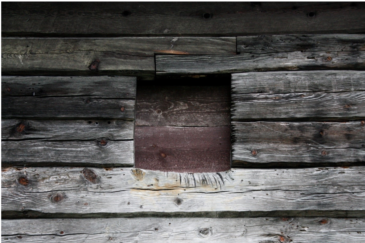
Figur 23. Detalj av vindaugslugge i langveggen mot vegen. Foto Arlen Bidne/Vestland fylkeskommune, 2022.