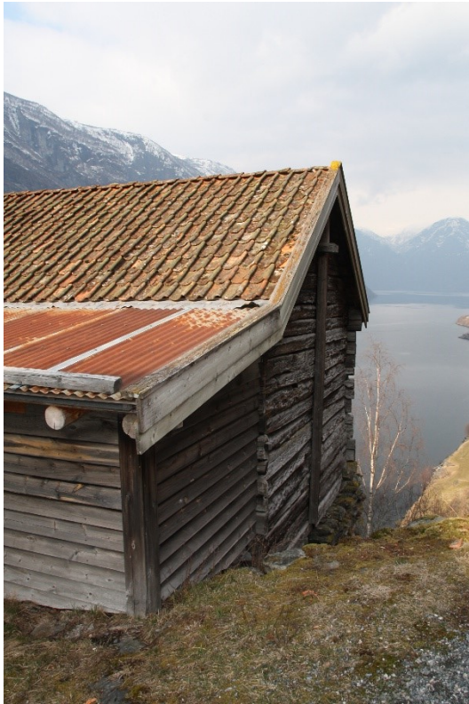
Hjørnet med gavlen mot stallen. Figur 43. Gavlen mot stallen. Begge foto Arlen Bidne/Vestland fylkeskommune, 2022.