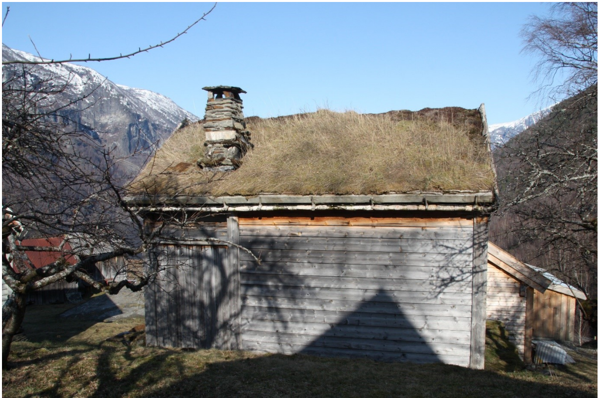
Figur 77. Langveggen sett frå hagen framfor Nystova i Guttormgarden. Foto Arlen Bidne/Vestland fylkeskommune, 2022.