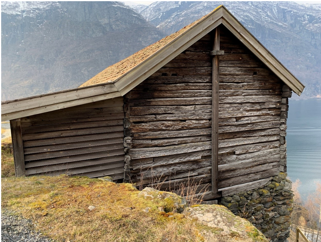
Gavlside sett frå stallen. Foto Arlen Bidne/Vestland fylkeskommune, 2022.