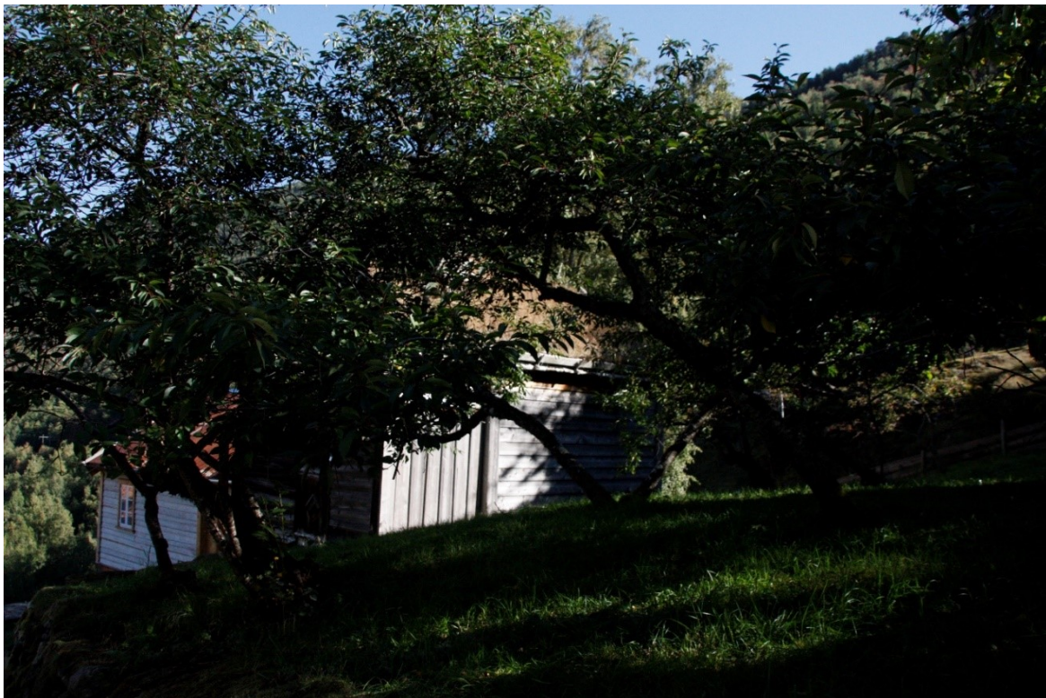
Figur 10. Håkonstova og Vetlastova sett frå hagen framfor Nystova i Guttormgarden. Foto Arlen Bidne/Vestland fylkeskommune, 2021.