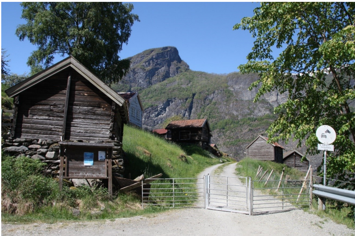
Figur 3. Tunet sett frå parkeringsplassen. Bygningane til Andersgarden er dei første ein møter. Foto Arlen Bidne/Vestland fylkeskommune, 2021.