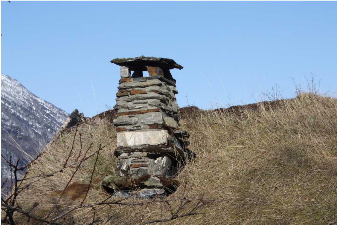
Figur 82. Pipe. Foto Arlen Bidne/Vestland fylkeskommune, 2022.