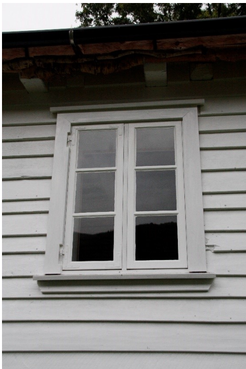
Figur 71. Vindauga på langsida mot tunet. Foto Arlen Bidne/Vestland fylkeskommune, 2022.