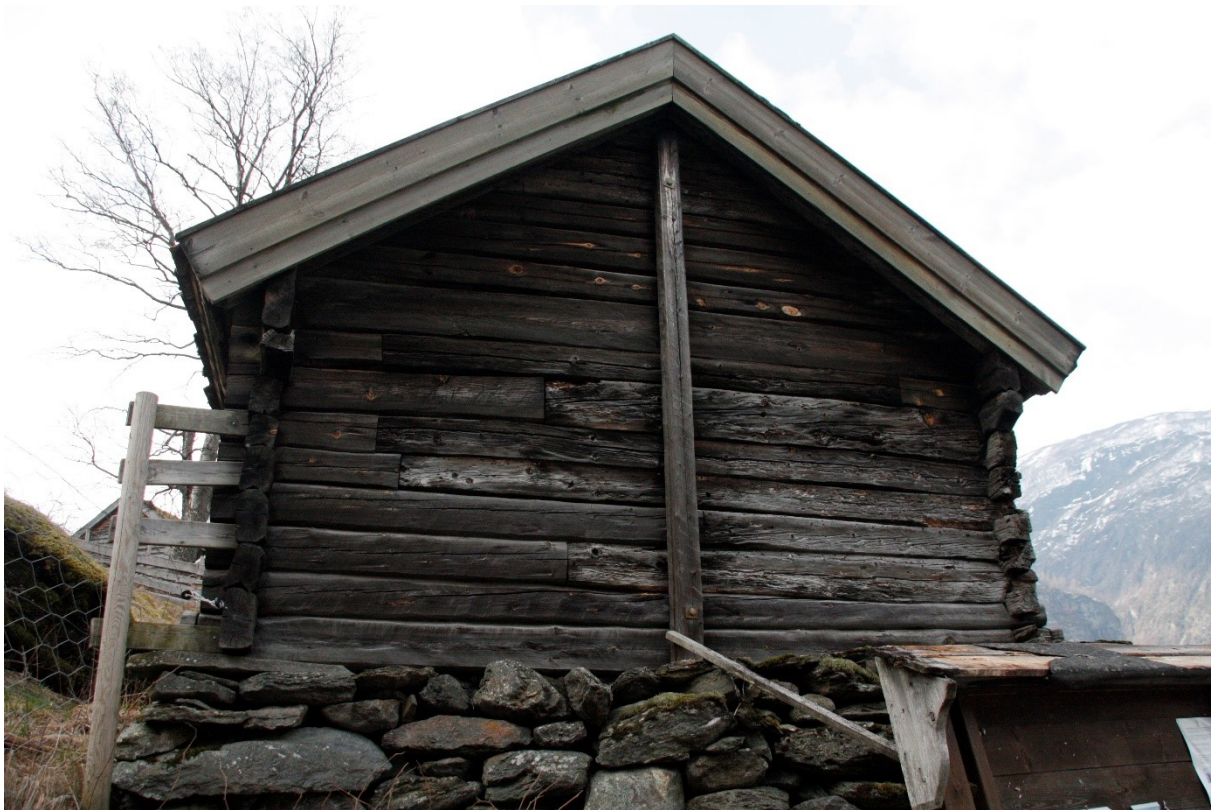
Figur 17. Gavlvegg mot parkeringsplass. Foto Arlen Bidne/Vestland fylkeskommune, 2022.