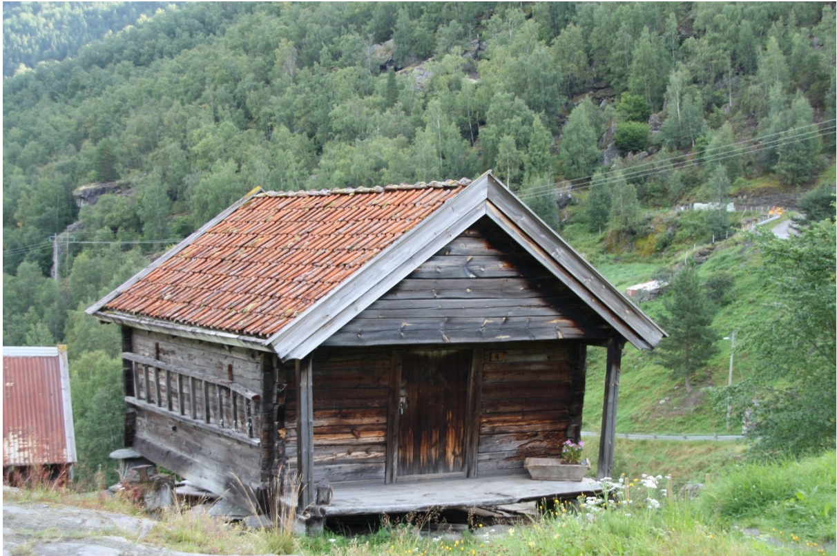
Figur 53. Gavlen med inngangsdøra.