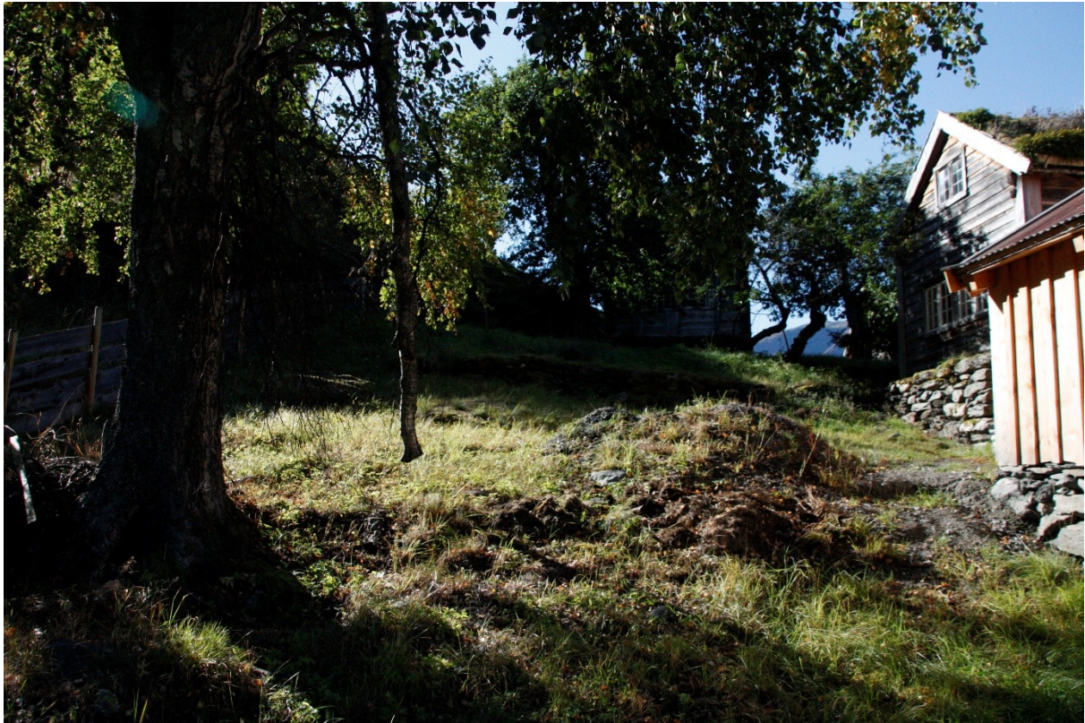
Figur 7. Hagen ved Håkonstova.