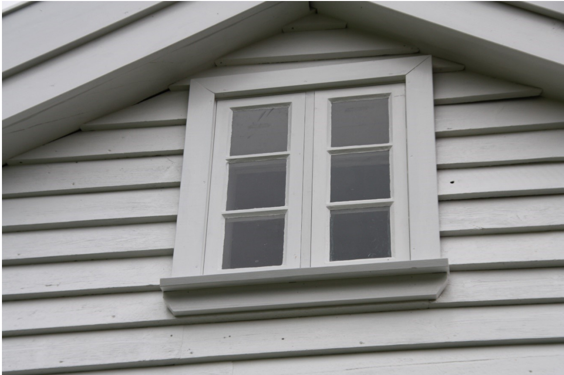
Figur 72. Vindauga i gavlen mot fjorden. Foto Arlen Bidne/Vestland fylkeskommune, 2022.