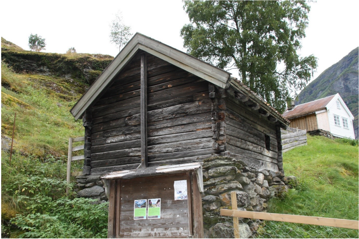
Figur 16. Eldhuset sett fra parkeringsplassen på veg inn i tunet. Foto Arlen Bidne/Vestland fylkeskommune, 2022.