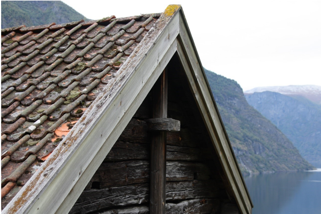
44. Gavlen mot aust detalj av takstein og feste til oppling. Foto Arlen Bidne/Vestland fylkeskommune, 2022. Figur