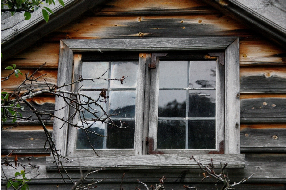
Figur 85. Vindauga i gavlen. Foto Arlen Bidne/Vestland fylkeskommune, 2022.