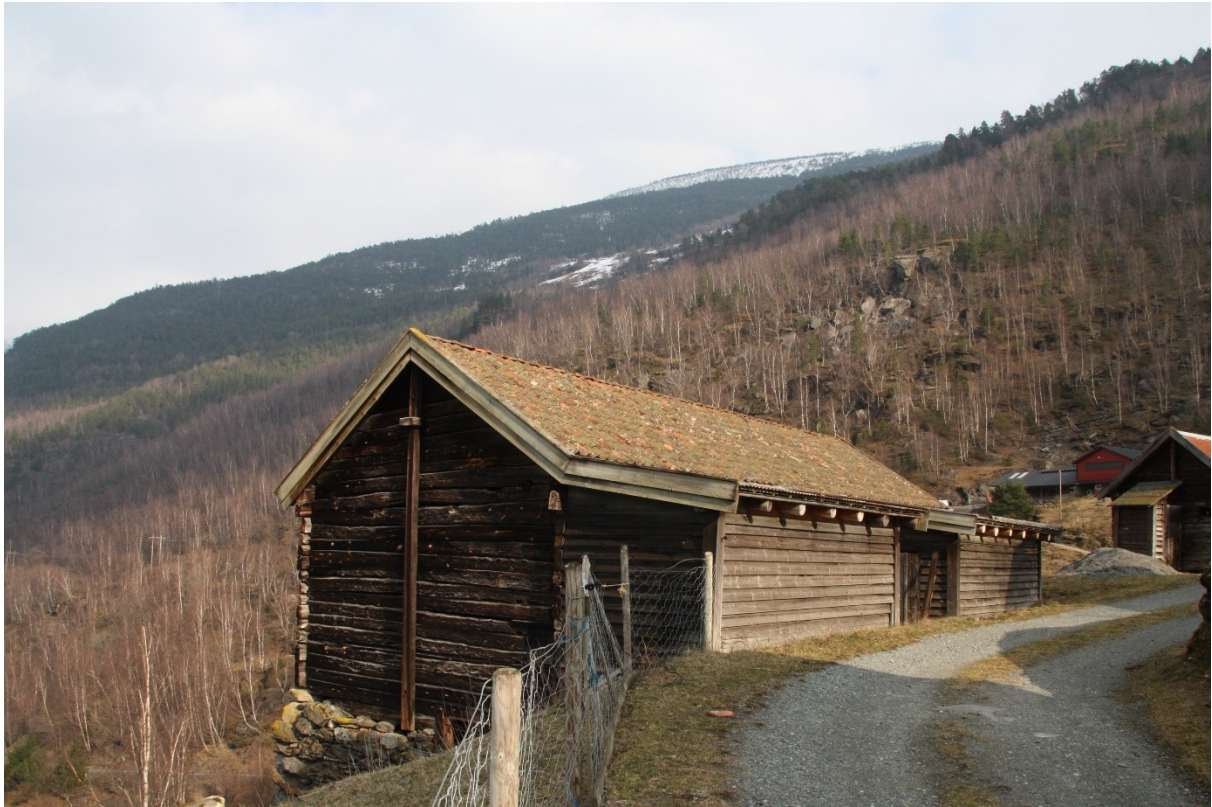
Figur 37. Løa sett frå vegen i retning parkeringsplassen. Foto Arlen Bidne/Vestland fylkeskommune, 2022.