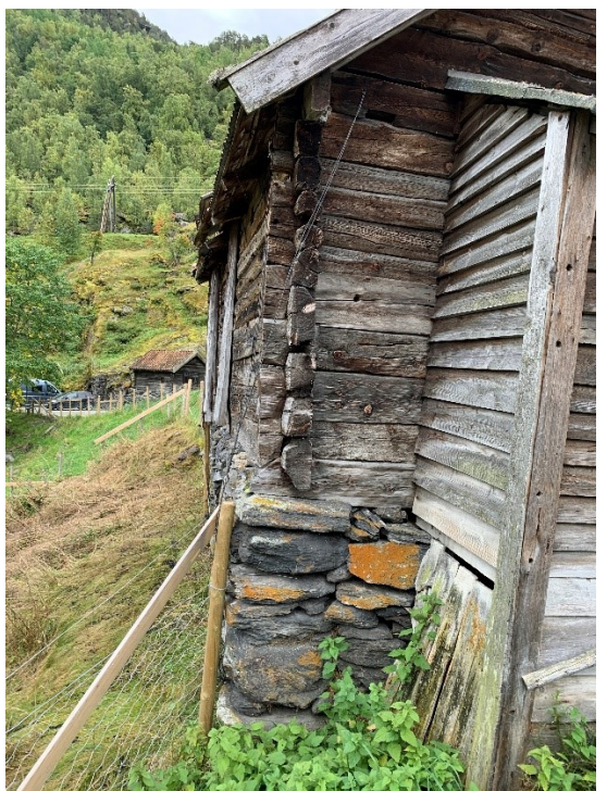
30 og Figur 31. Tilbygget med utedoen. Foto Arlen Bidne/Vestland fylkeskommune 2022.