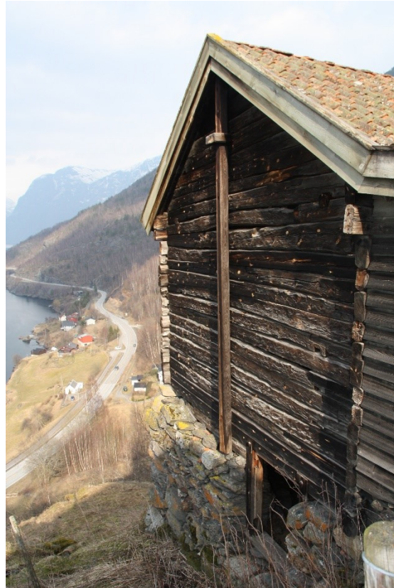
og figur 39. Gavlvegg. 2022.