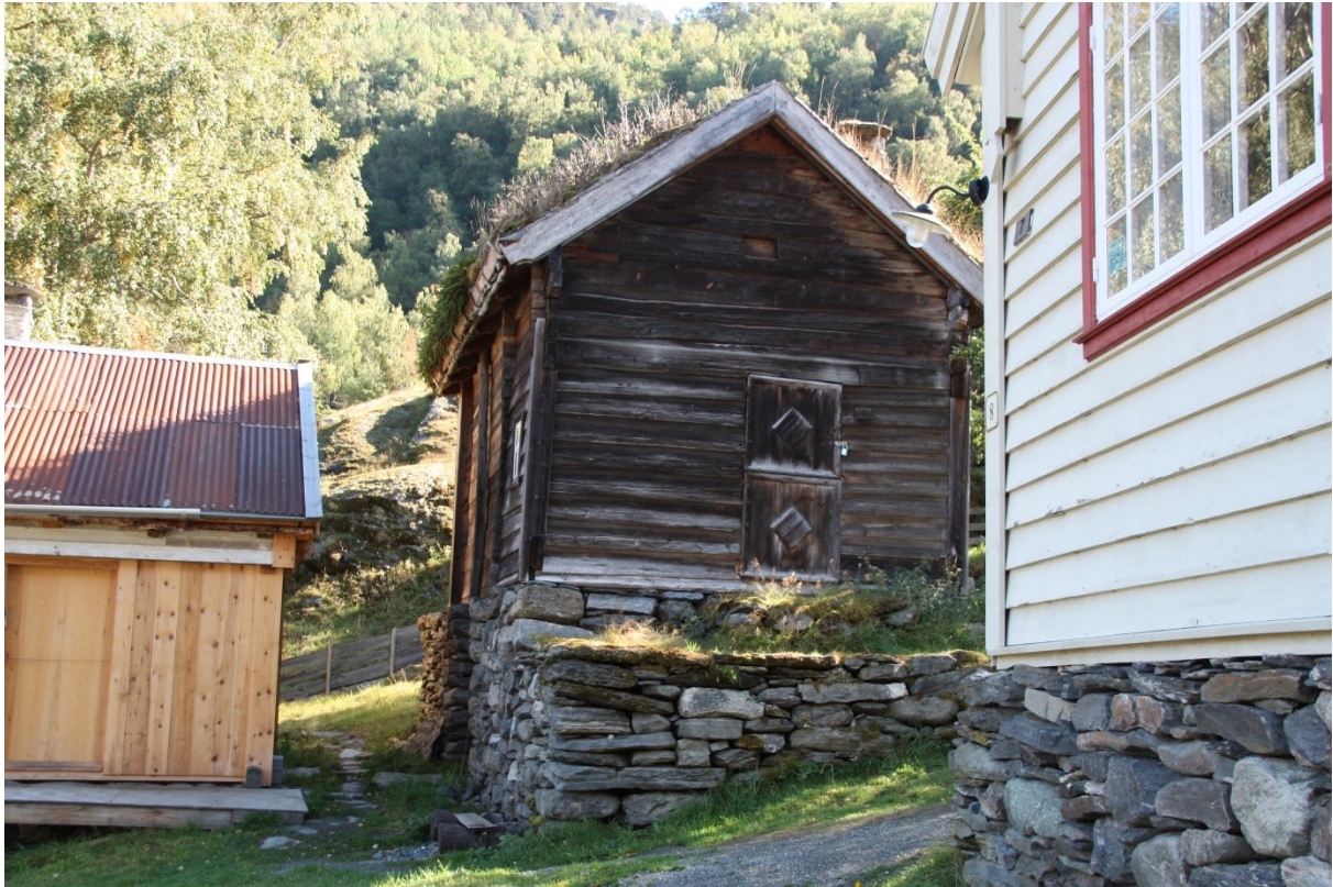
Figur 76. Gavlen med inngangsdøra. Foto Arlen Bidne/Vestland fylkeskommune, 2021.