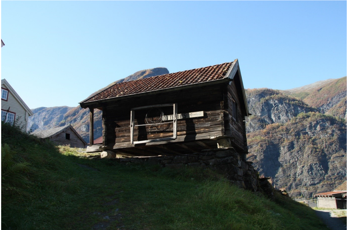
Figur 48. Stabburet sett frå vegen ved parkeringsplassen. Foto Arlen Bidne/Vestland fylkeskommune, 2021.