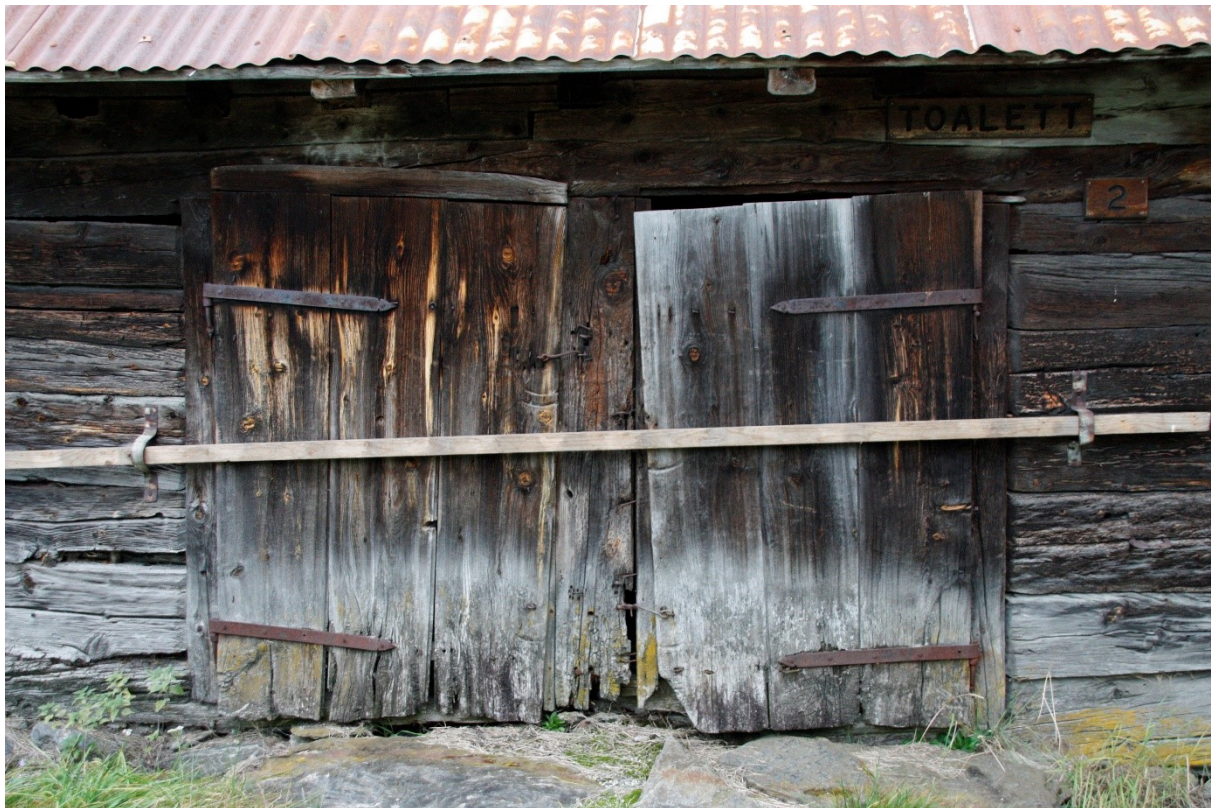
Figur 34. Inngangsdørene til stallen. Døra til venstre er inn til stallen, døra til høyre er inn til toalett. Foto Arlen Bidne/Vestland fylkeskommune, 2022.