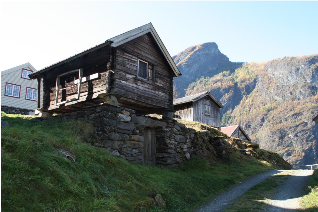
Figur 49. Stabburet sett frå køyrevegen inn i tunet. Foto Arlen Bidne/Vestland fylkeskommune, 2021.