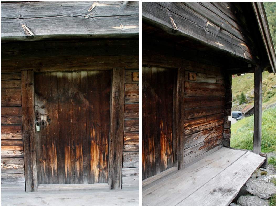
Figur 56 og

Vindaugsopninga i gavlen, med innvendige lemmar og netting ytst. Foto Arlen Bidne/Vestland fylkeskommune, 2022.