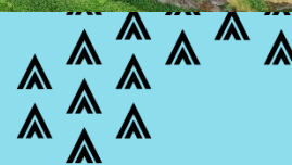
Foto av Andersgarden - eksteriør