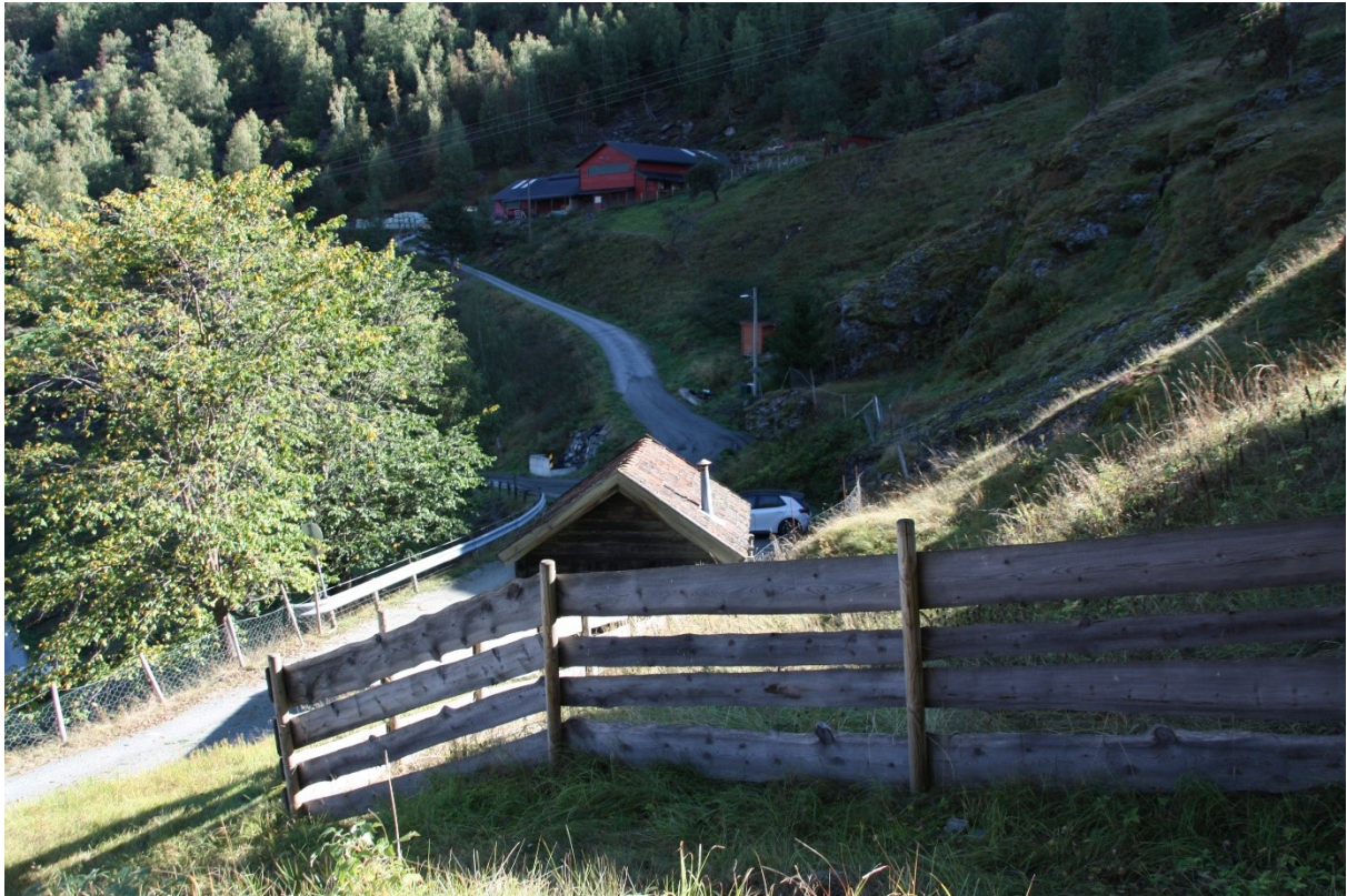
Figur 15. Utsikt frå hagen ved Håkonstova mot vegen og parkeringsplassen.