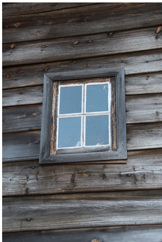
Figur 83. Inngangsdør. Figur 84. Vindauga i langsida mot Andersgarden. Begge foto Arlen Bidne/Vestland fylkeskommune, 2022.