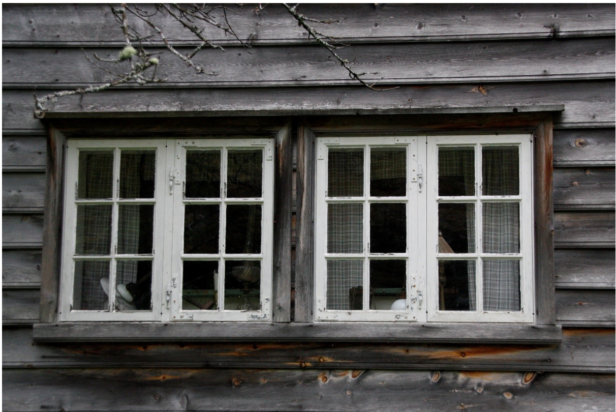
Figur 86. Vindauga til stova i første etasje. Foto Arlen Bidne/Vestland fylkeskommune, 2022.