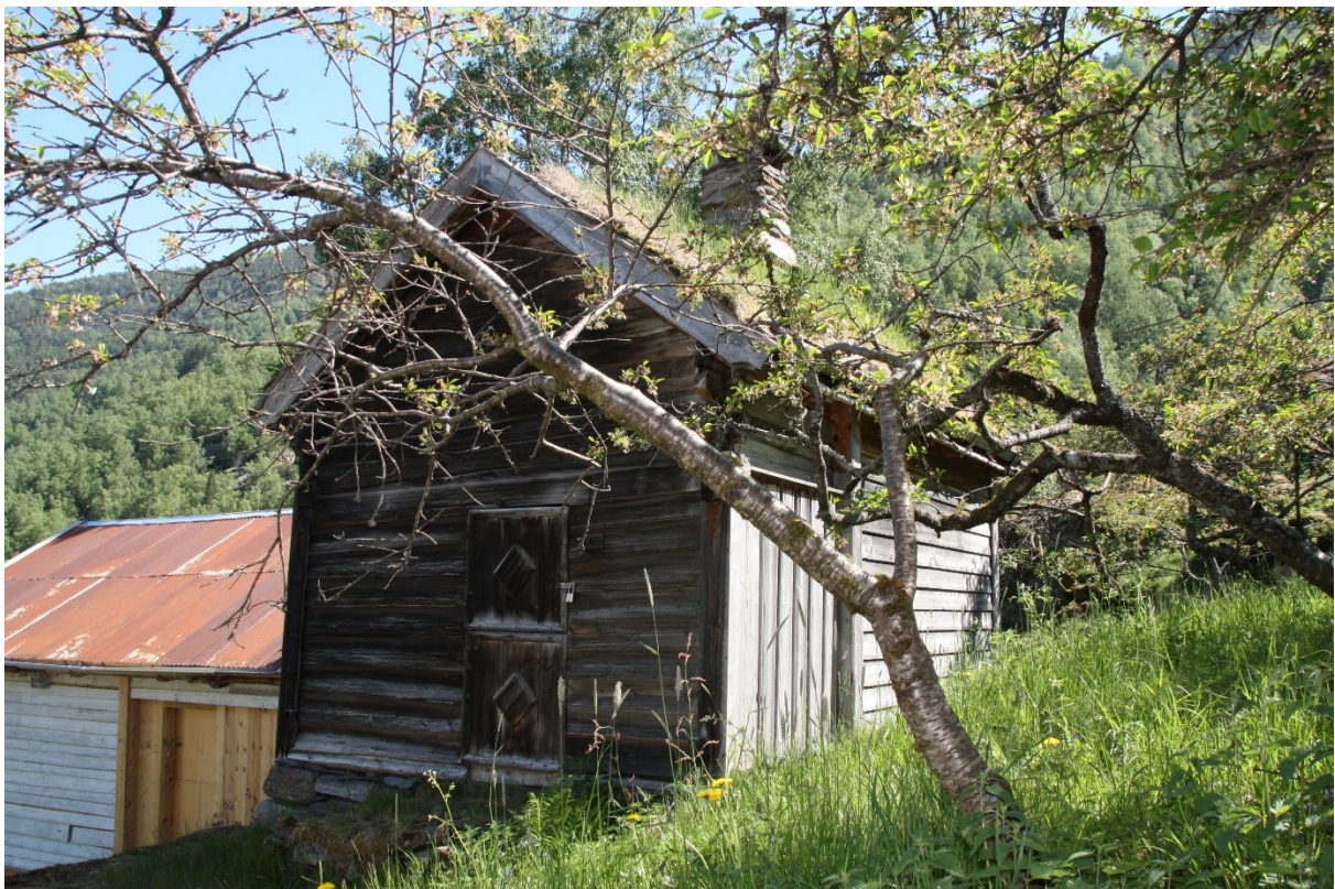
Figur 81. Gavlveggen med inngangsdøra og langveggen mot hagen ved Nystova i Guttormgarden. 2021.