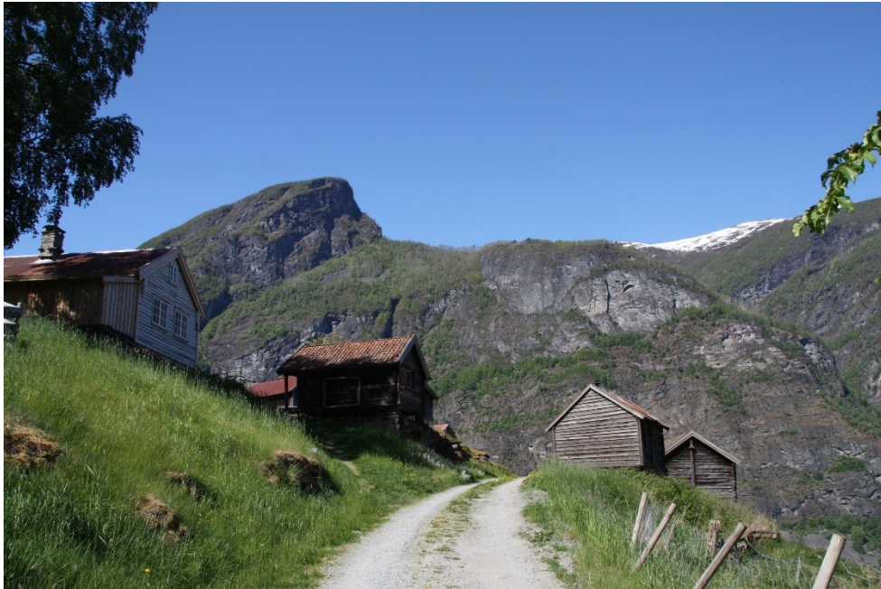
Figur 2. Fire av bygningane i Andersgarden. Frå venstre er Håkonstova, stabburet, stall og løe. Foto Arlen Bidne/Vestland fylkeskommune, 2021.