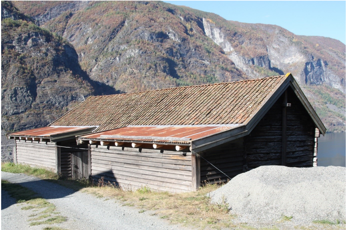
Figur 40. Løa sett frå vegen mot fjorden. Foto Arlen Bidne/Vestland fylkeskommune, 2021.