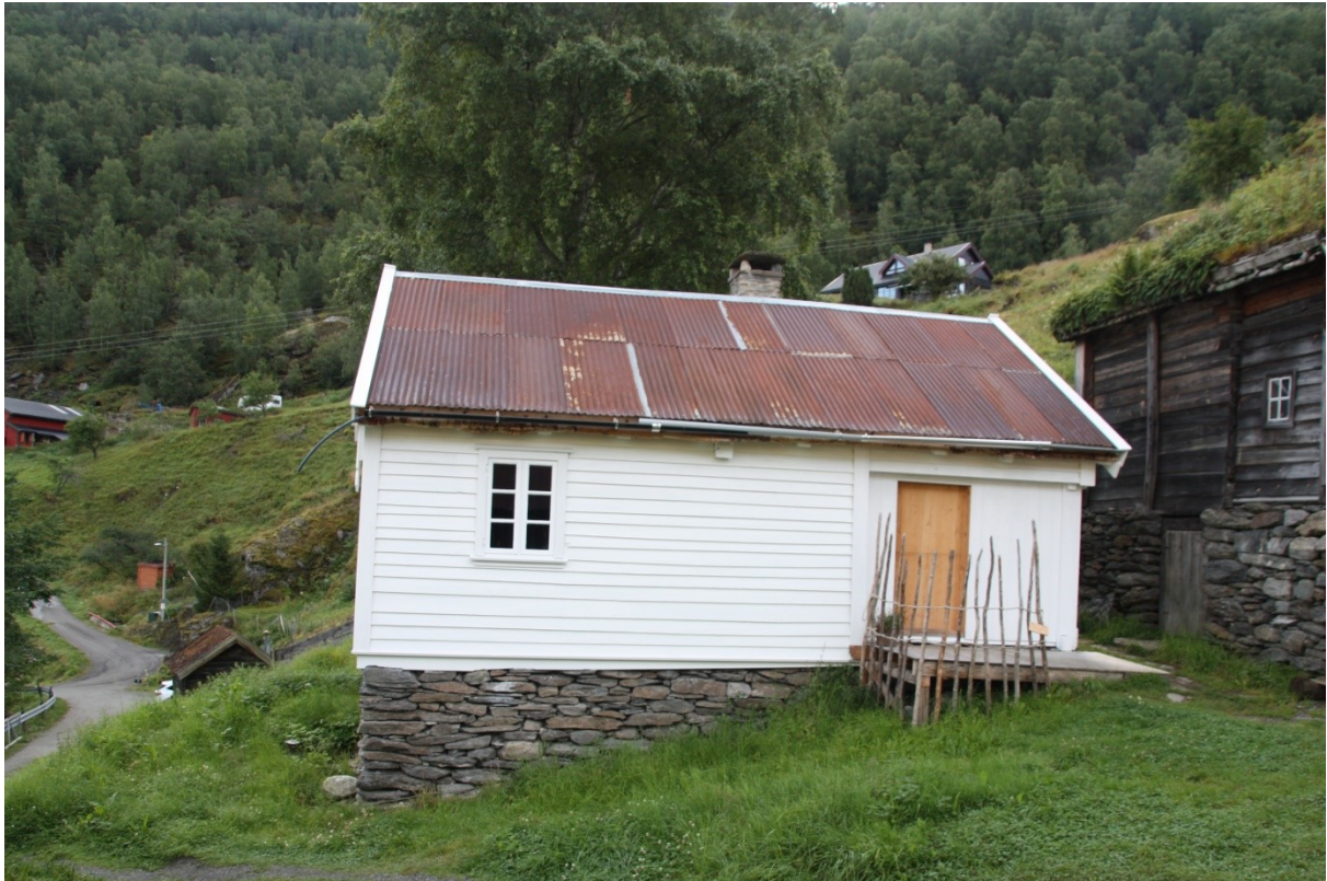
Figur 68. Langsida med inngangsdør. Foto Arlen Bidne/Vestland fylkeskommune, 2022.