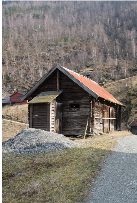
Figur 28. Gavlveggen sett frå vegen mot parkeringsplassen. Figur 29. Gavlvegg og langside mot vegen.