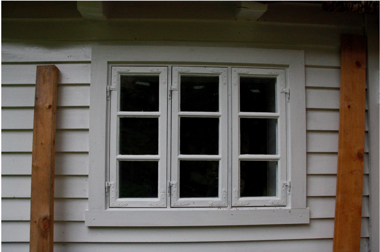
Figur 70. Vindauga på langveggen med tilbygg. Foto Arlen Bidne/Vestland fylkeskommune, 2022.