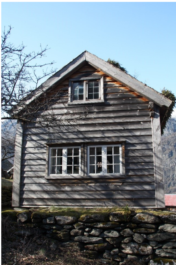
Figur 79. Gavlveggen. Foto Arlen Bidne/Vestland fylkeskommune, 2022.