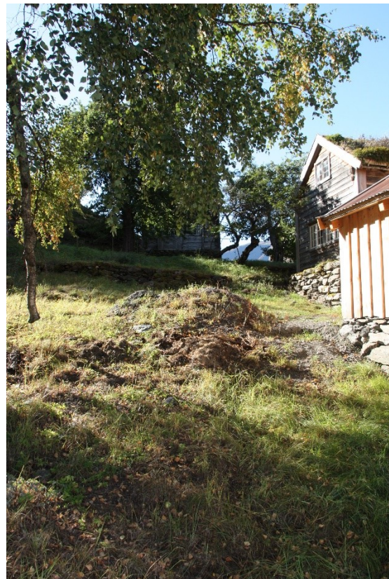
Figur 5 og Figur 6. Håkonstova med den store bjørka i hagen, til høyre er hagen ved Håkonstova og Vetlastova. Foto Arlen Bidne/Vestland fylkeskommune, 2021.