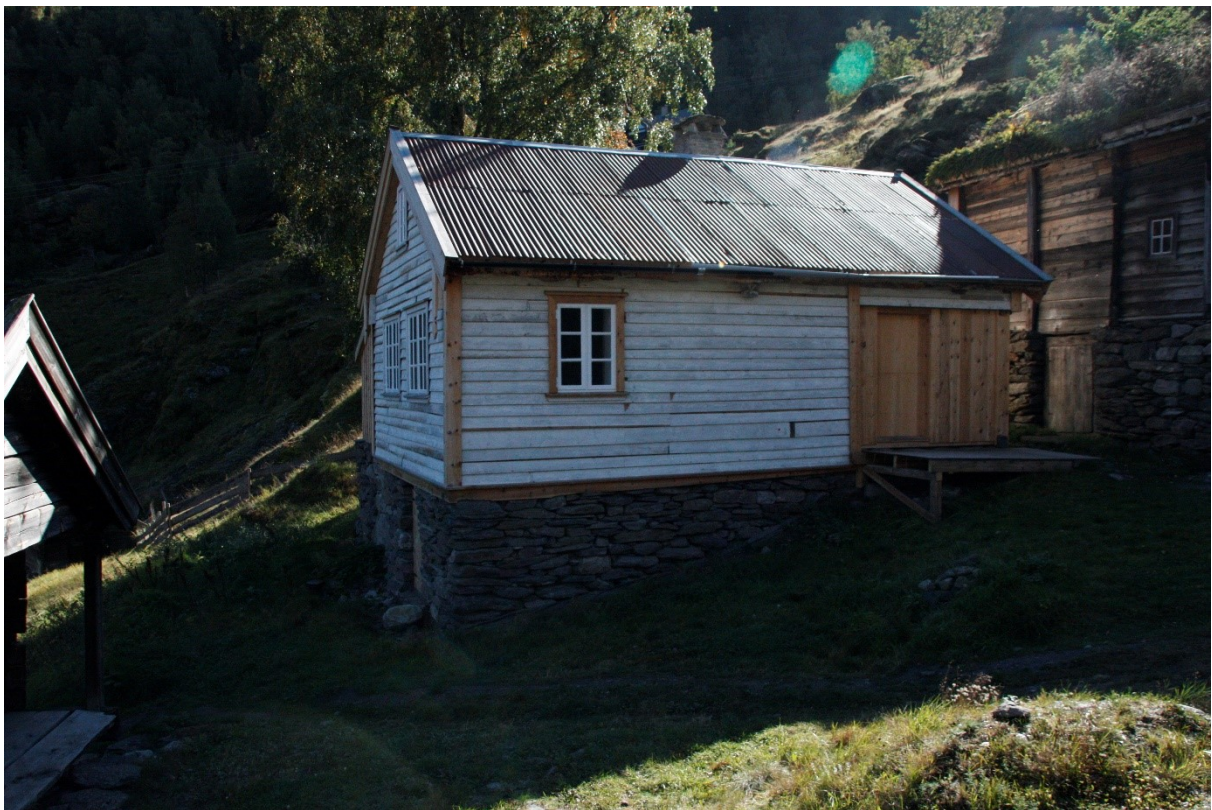
Figur 69. Langsida og gavlen mot fjorden.