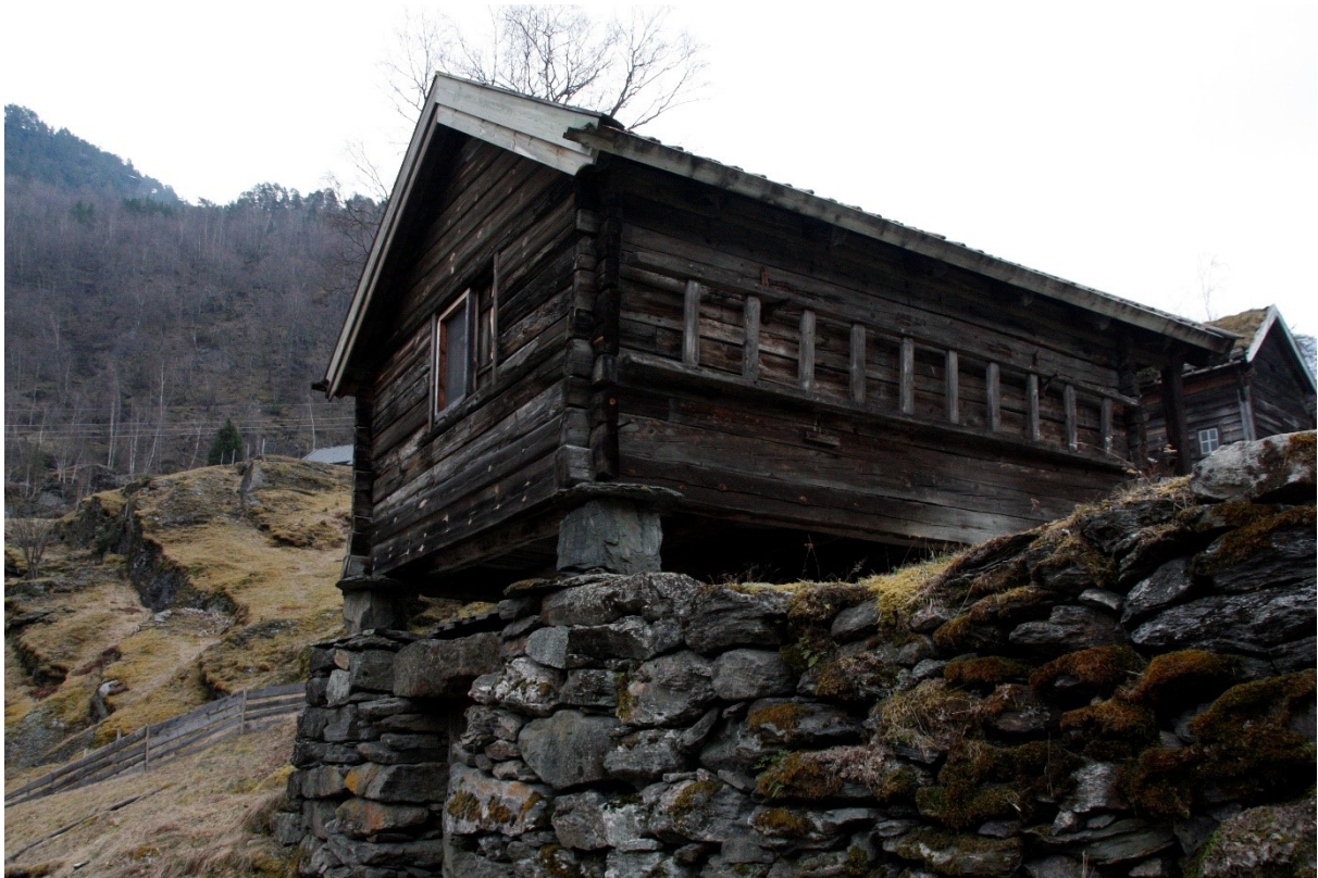
Figur 50. Gavlvegg mot fjorden og langvegg. Foto Arlen Bidne/Vestland fylkeskommune, 2022.