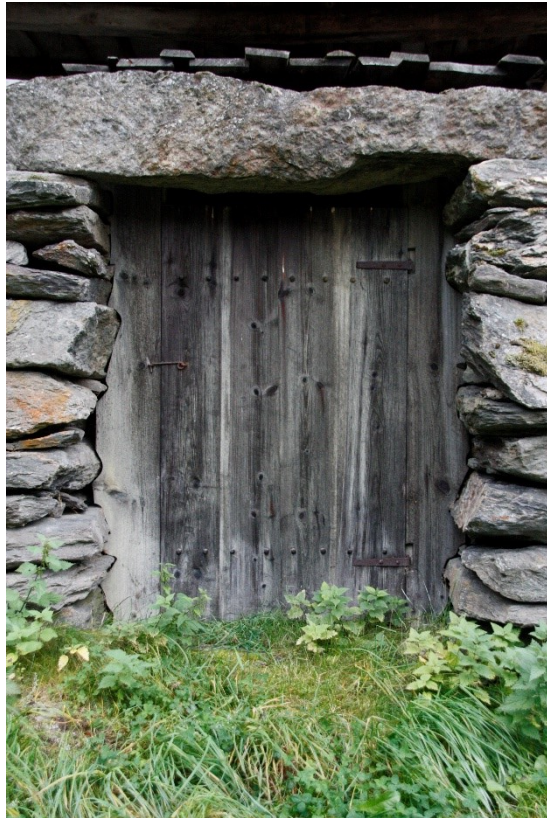
Figur 60 og Figur 61. Til venstre detalj av stabbe i stein i front av stabburet. Til høyre kjellardøra.