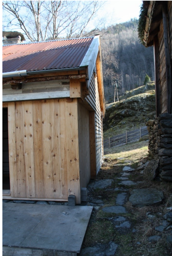
Figur 66 og Figur 67. Gavlside inn mot Vetlastova.