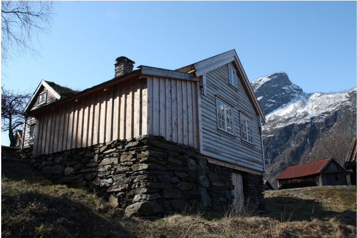
Figur 63. Langside med skot og gavlfasaden mot fjorden. Foto Arlen Bidne/Vestland fylkeskommune, 2022.