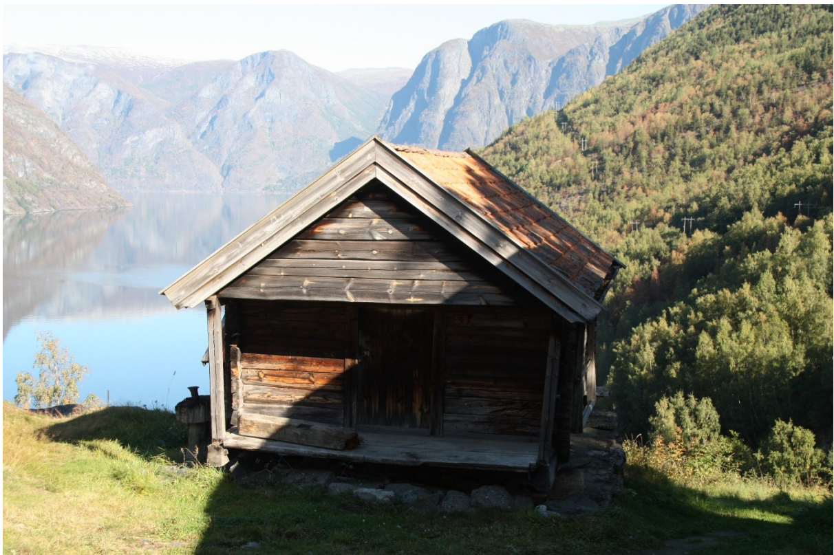
Figur 54. Gavlen med inngangsdøra. Foto Arlen Bidne/Vestland fylkeskommune, 2021.