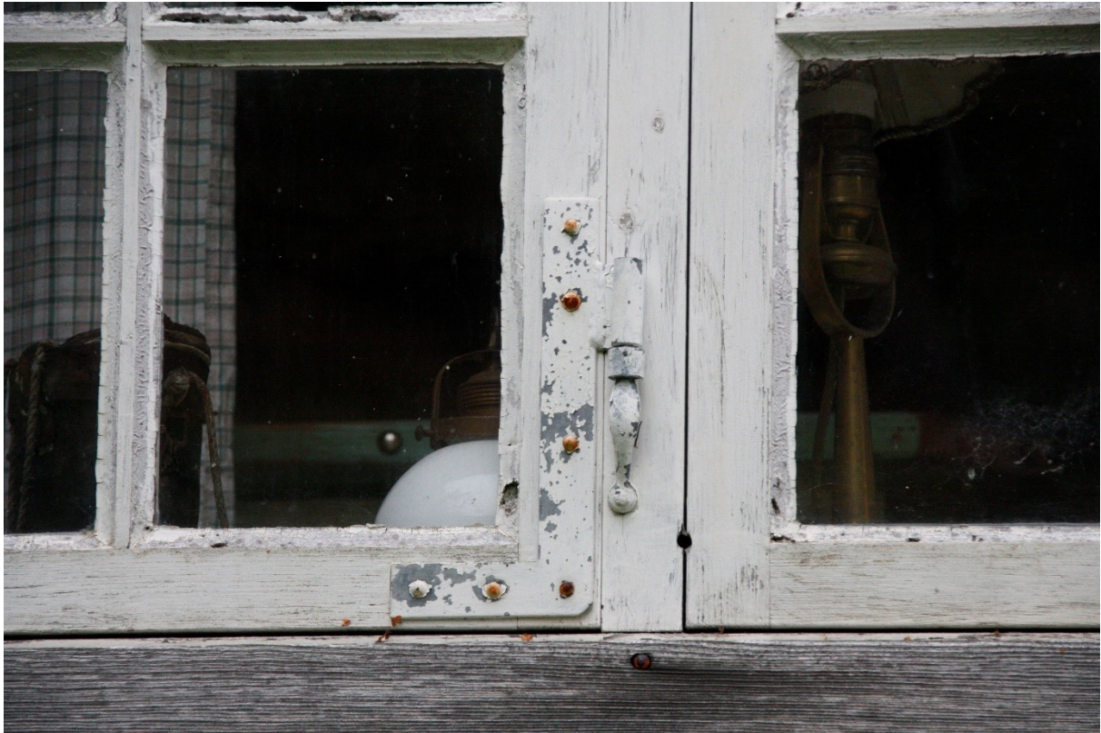
Figur 87. Detalj av vindaugshengsle til stovevindauga.