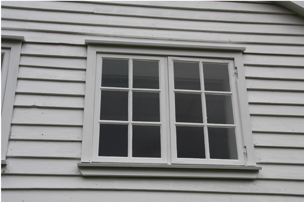
Figur 73. Vindauga i første etasje i gavlen mot fjorden. Foto Arlen Bidne/Vestland fylkeskommune, 2022.