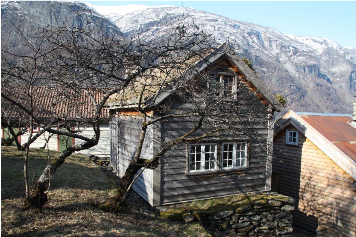
Figur 78. Gavlen og langsida mot hagen til Nystova i Guttormgarden. Foto Arlen Bidne/Vestland fylkeskommune, 2022.