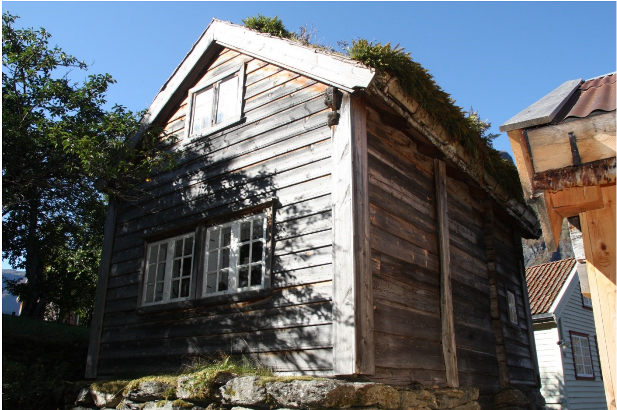
Figur 80. Gavlen mot vegen opp til tunet og langveggen mot Håkonstova.