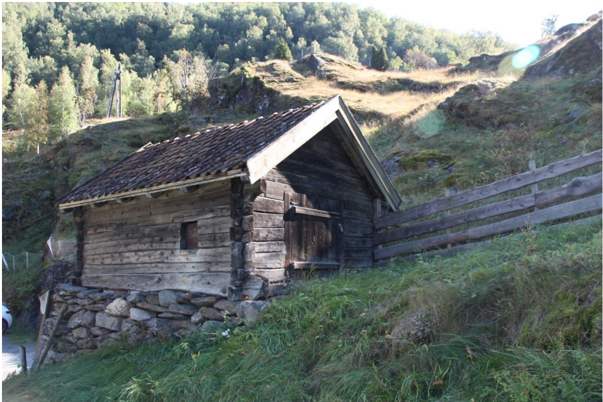
Figur 20. Eldhuset sett frå tunet mot parkeringsplassen. Gavlpartiet med inngangsdøra. Foto Arlen Bidne/Vestland fylkeskommune, 2021.