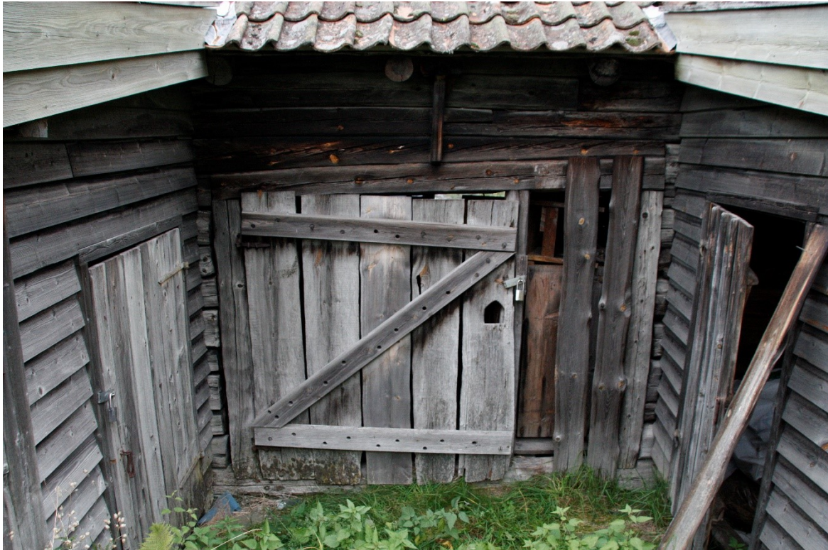
Figur 45. Dør inn til låven. På kvar side av døra er det nyare inngangsdører til tilbygga.