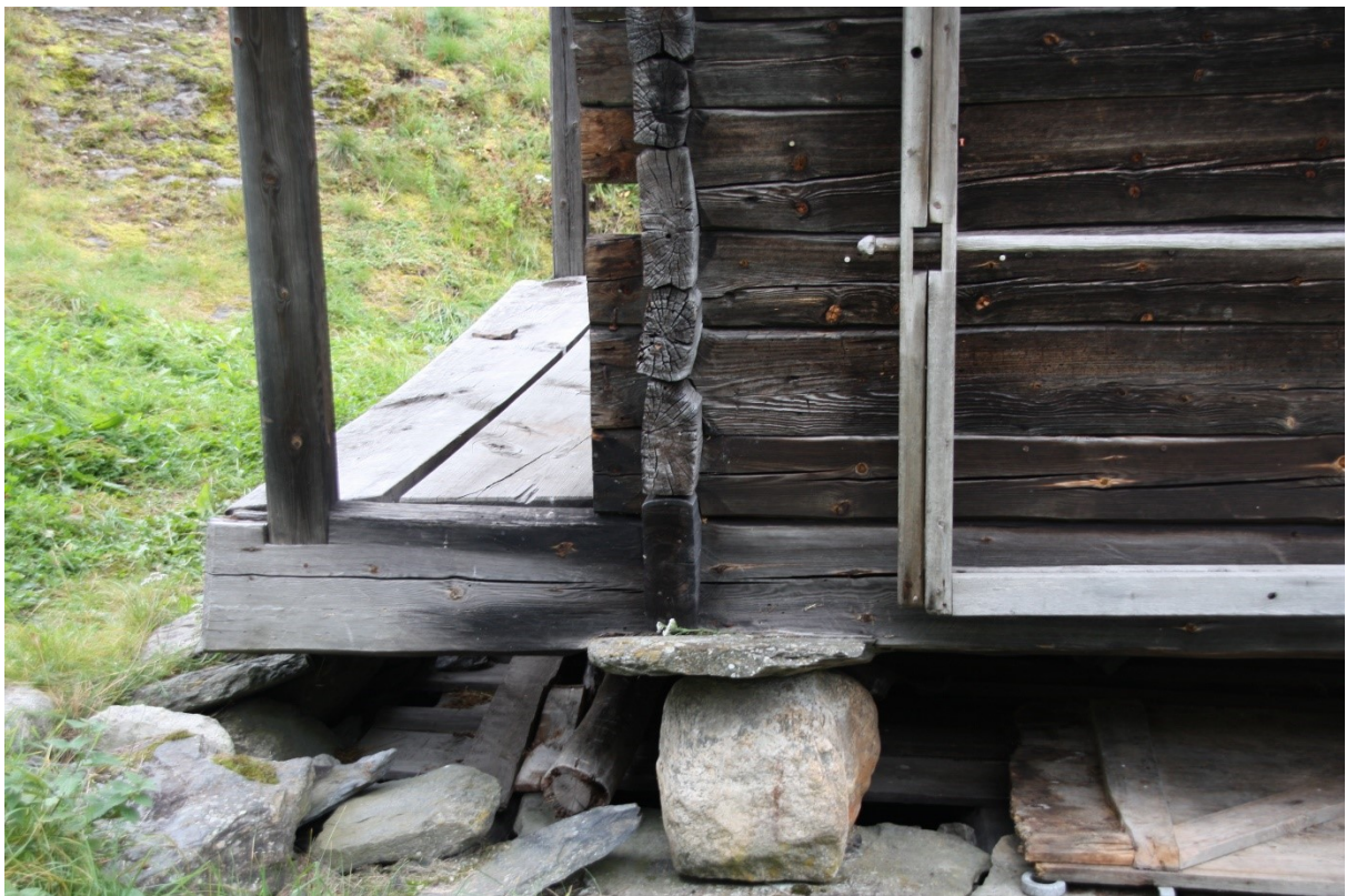
Figur 59. Detalj av stabben ved inngangsdøra. Foto Arlen Bidne/Vestland fylkeskommune, 2022.