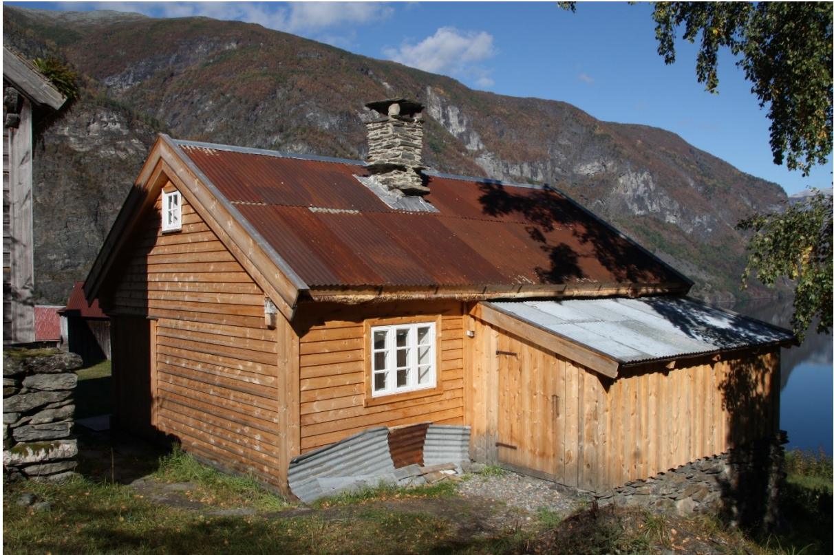
Figur 65. Gavlside og langside med tilbygg sett mot fjorden. Foto Arlen Bidne/Vestland fylkeskommune, 2021.