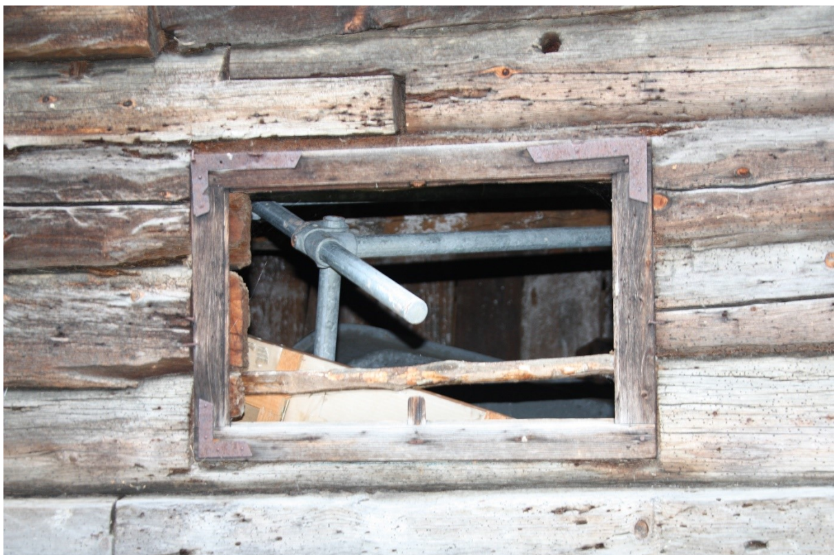
Figur 35. Vindaugsopninga inn til stallen. Foto Arlen Bidne/Vestland fylkeskommune, 2022.