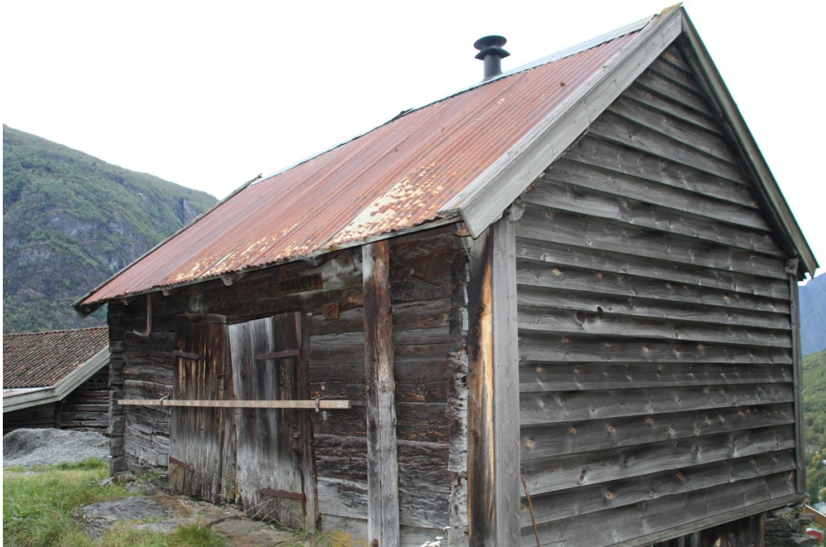
Figur 26. Langside og gavlvegg. Foto Arlen Bidne/Vestland fylkeskommune, 2022.