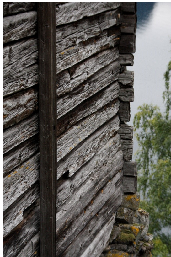
Figur 46 og Figur 47. Til venstre dør inn til kjellaren i gavlen mot vest. Til høgre detaljar av tømmervegg og lafteknutar. Foto Arlen Bidne/Vestland fylkeskommune, 2022.