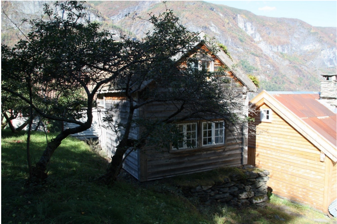
Figur 9. Vetlastova og del av hagen ved nystova i Guttormgarden.