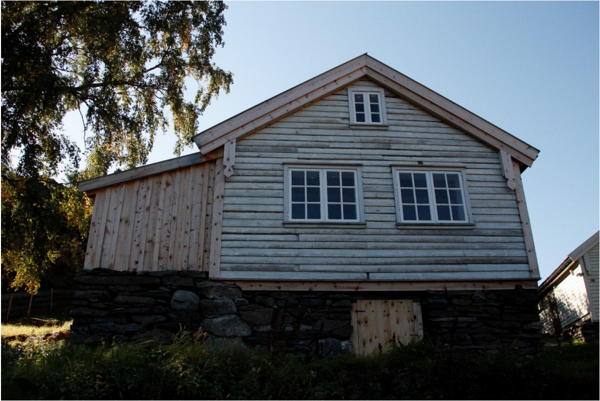
Figur 62. Fasaden mot fjorden.