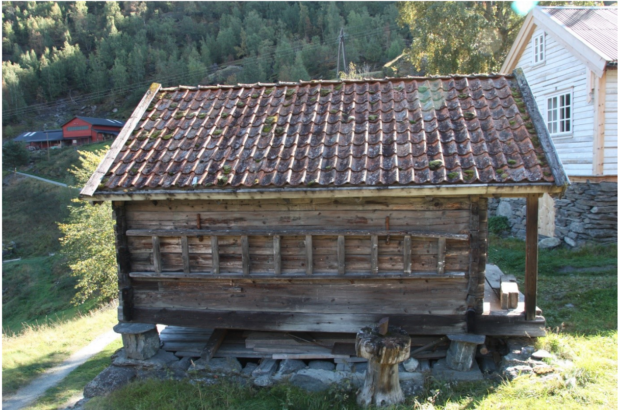
Figur 51. Langsida av stabburet sett mot parkeringsplassen. Håkonstova i bakgrunnen. Foto Arlen Bidne/Vestland fylkeskommune, 2021.