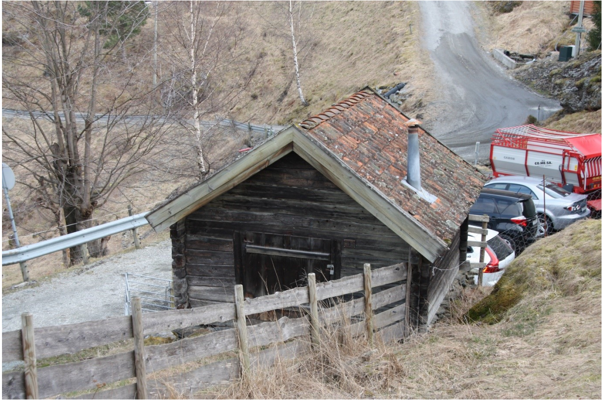
Figur 21. Gavlvegg med inngangsdøra, og langvegg. Foto Arlen Bidne/Vestland fylkeskommune, 2022.