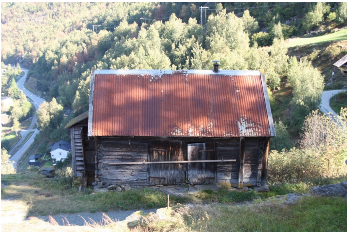
Figur 27. Stall og sauefjøs sett frå knausen ovanfor vegen. Foto Arlen Bidne/Vestland fylkeskommune, 2021.