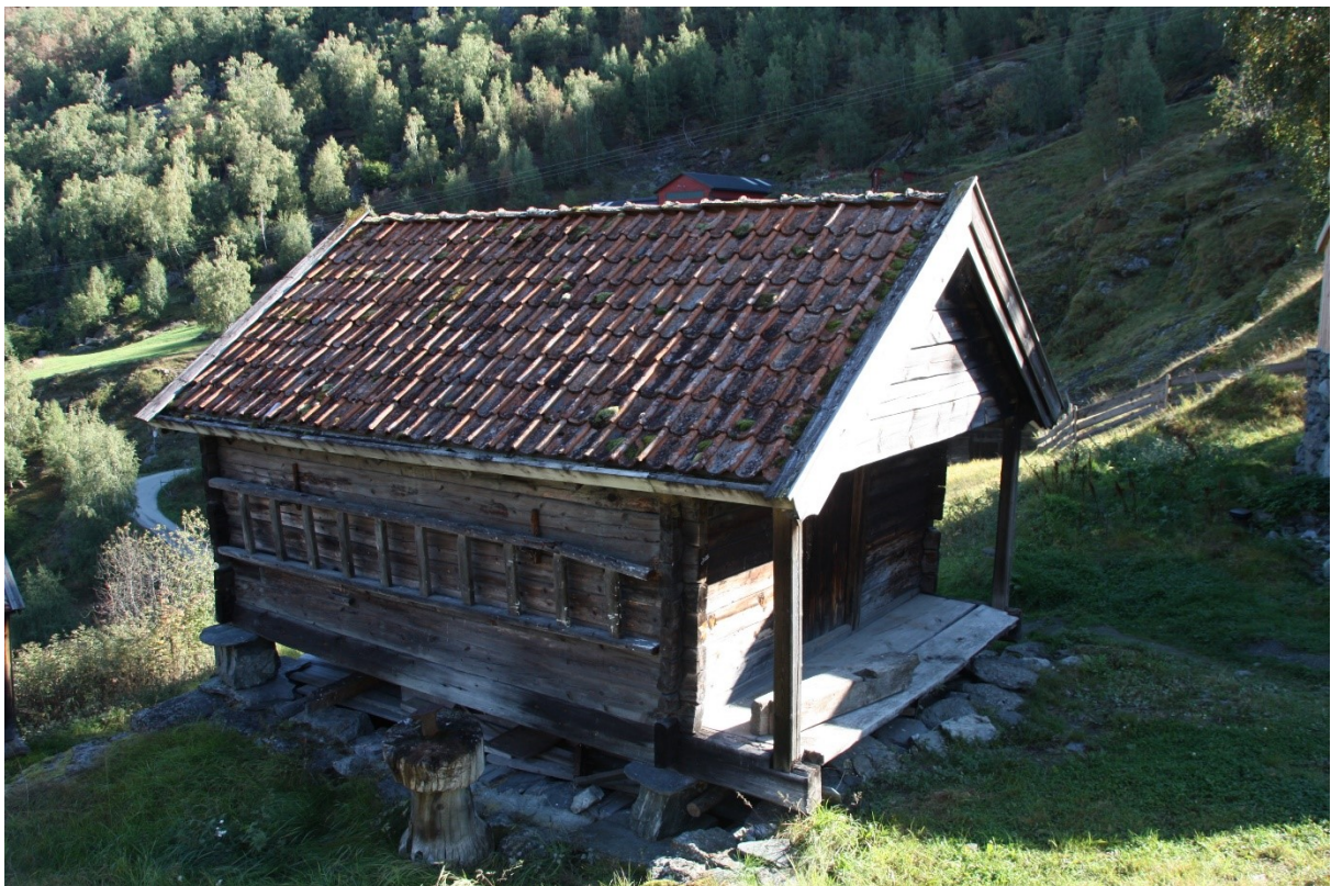
Figur 52. Langside og gavlvegg inn i tunet. Foto Arlen Bidne/Vestland fylkeskommune, 2021.