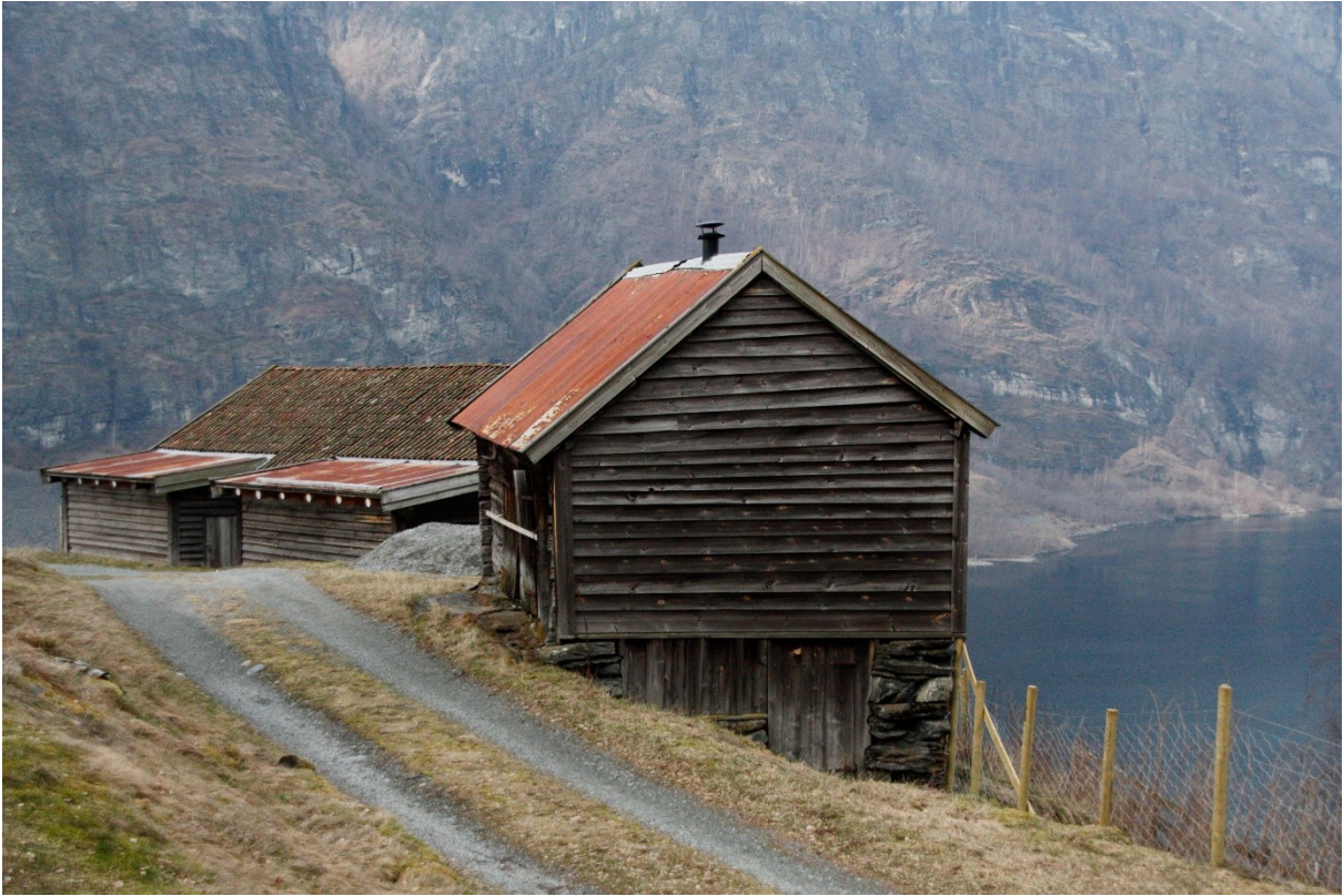
Figur 25. Gavlveggen sett frå eldhuset. Foto Arlen Bidne/Vestland fylkeskommune, 2022.