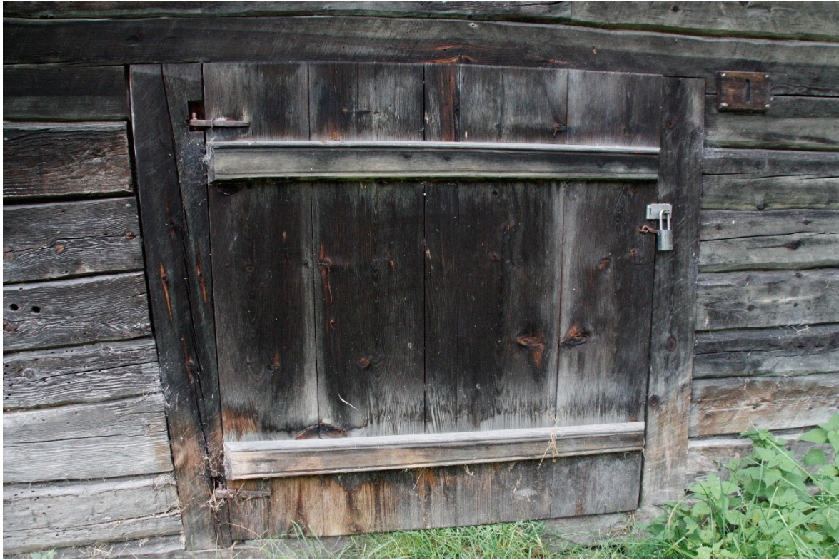
Figur 22. Eldhusdøra. Foto Arlen Bidne/Vestland fylkeskommune, 2022.