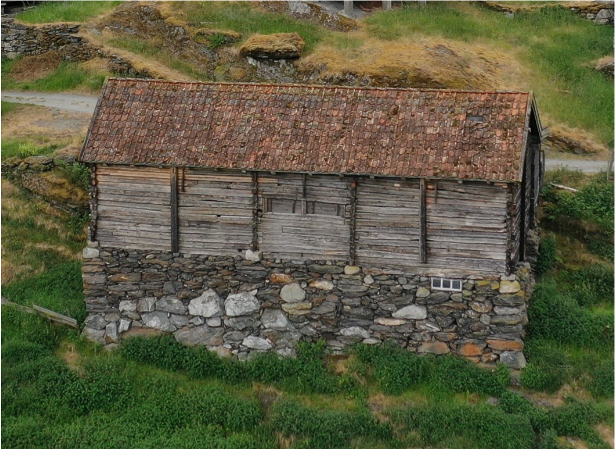
Figur 36. Langsida mot fjorden. Utsnitt av dronelfoto, Glenn Heine Orkelbog, 2021.