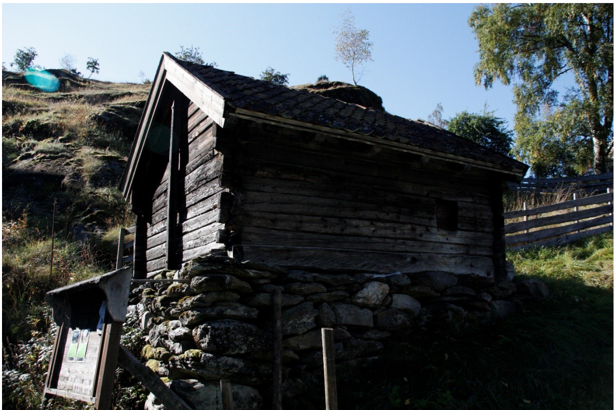
Figur 18. Langveggen til eldhuset sett frå vegen. Foto Arlen Bidne/Vestland fylkeskommune, 2021.