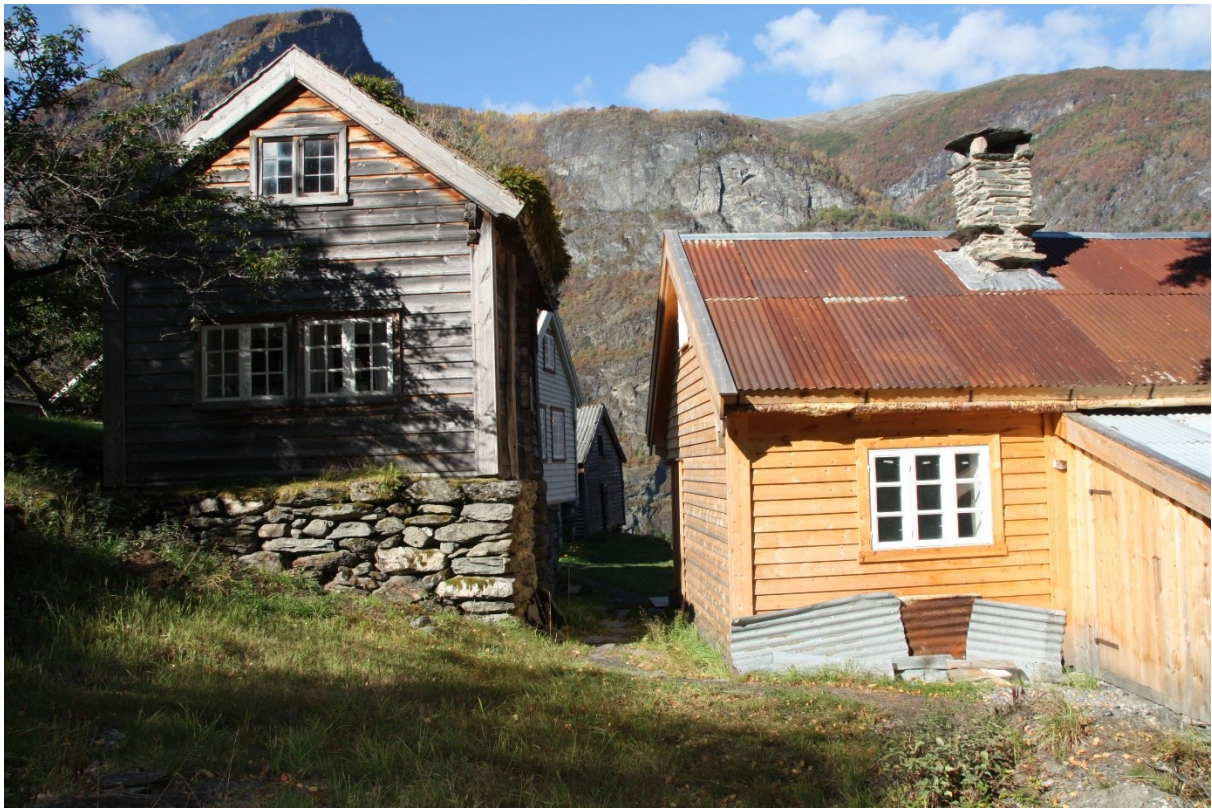
Figur 8. Vetlastova og Håkonstova. Foto Arlen Bidne/Vestland fylkeskommune, 2021.