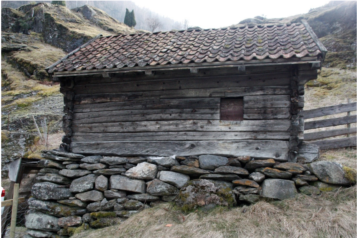
Figur 19. Langvegg mot vegen. Foto Arlen Bidne/Vestland fylkeskommune, 2022.