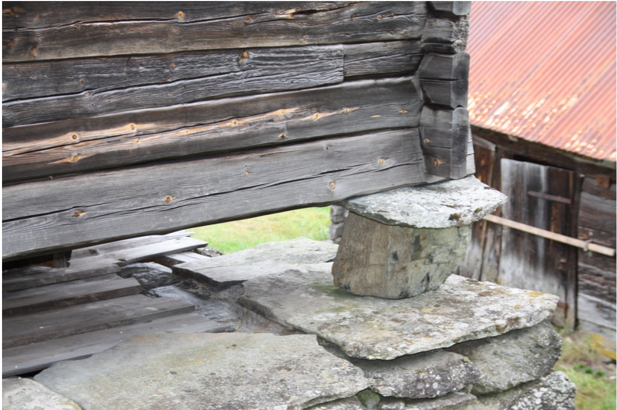
Figur 58. Stabben i stein som står på den høge muren i front av stabburet. Biletet viser også litt av tretaket over kjellaren under stabburet.