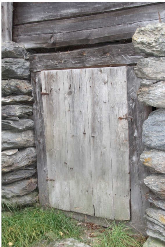
Figur 88. Kjellardøra.