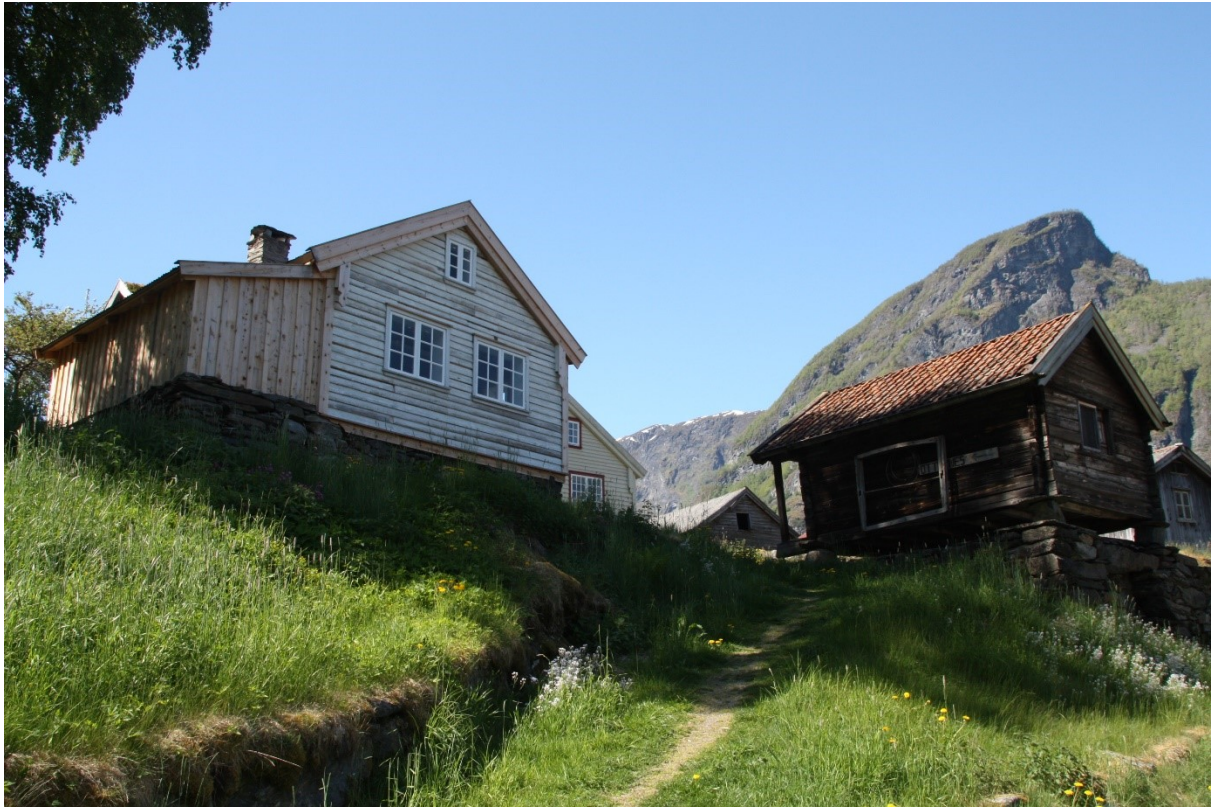
Figur 4. Håkonstova og stabburet.