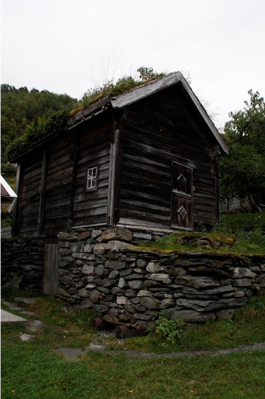
Figur 75. Langveggen mot Håkonstova og gavlen med inngangsdøra.