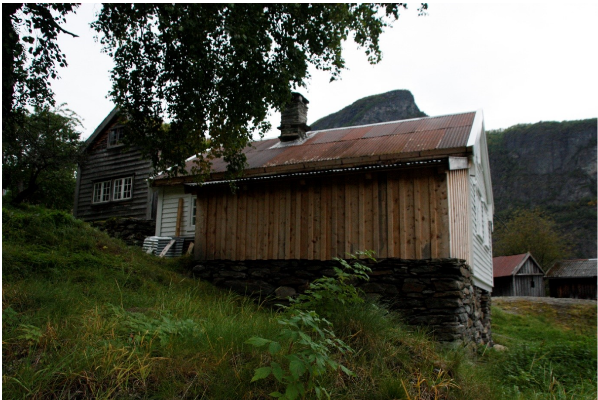
Figur 64. Langside med skot. Foto Arlen Bidne/Vestland fylkeskommune, 2022.