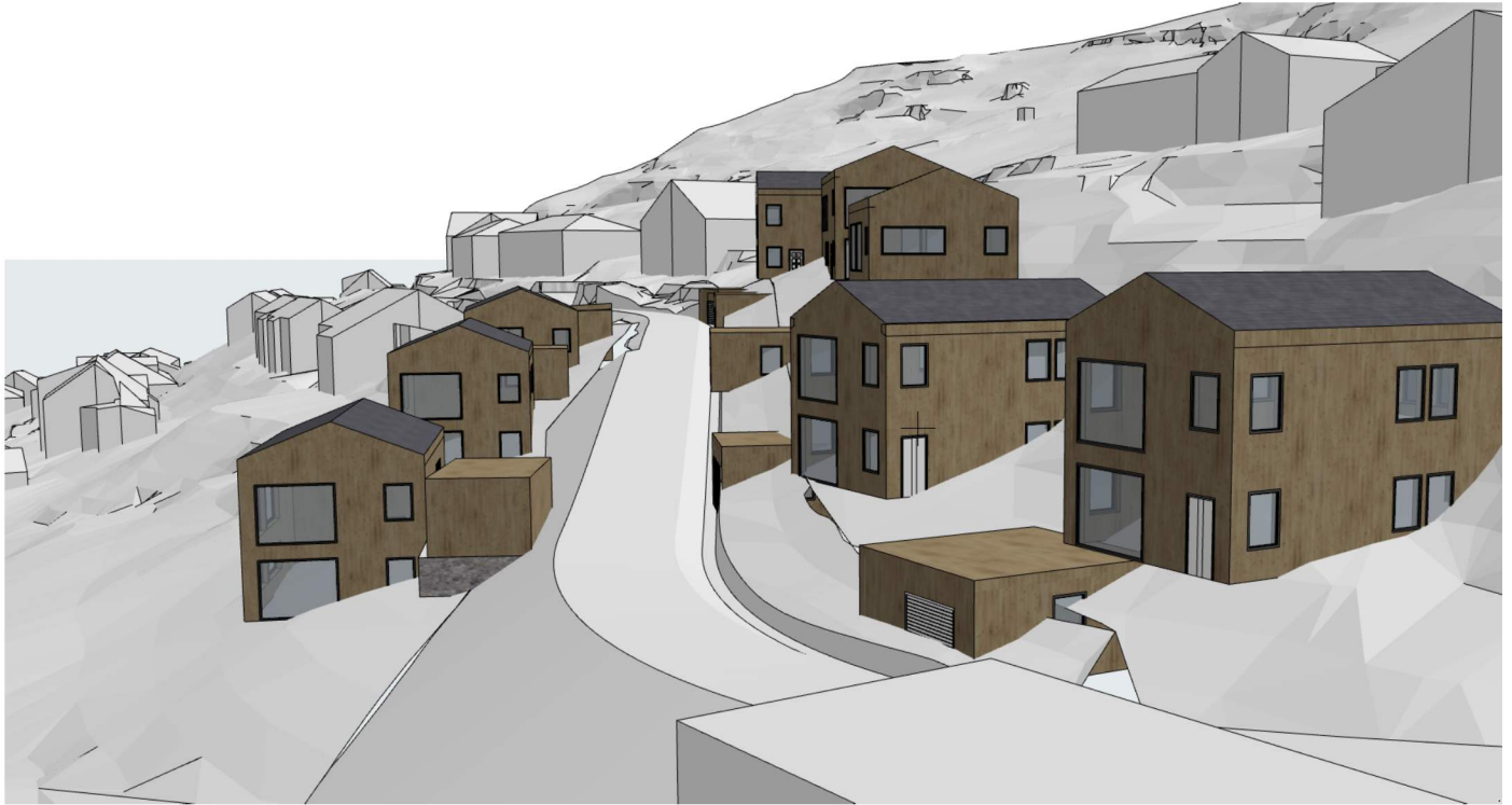
Forslag til plassering av einebustader sett frå sør