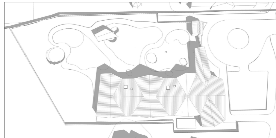
28. juni kl 10