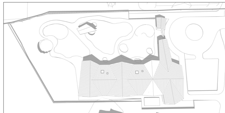
28. juni kl 12