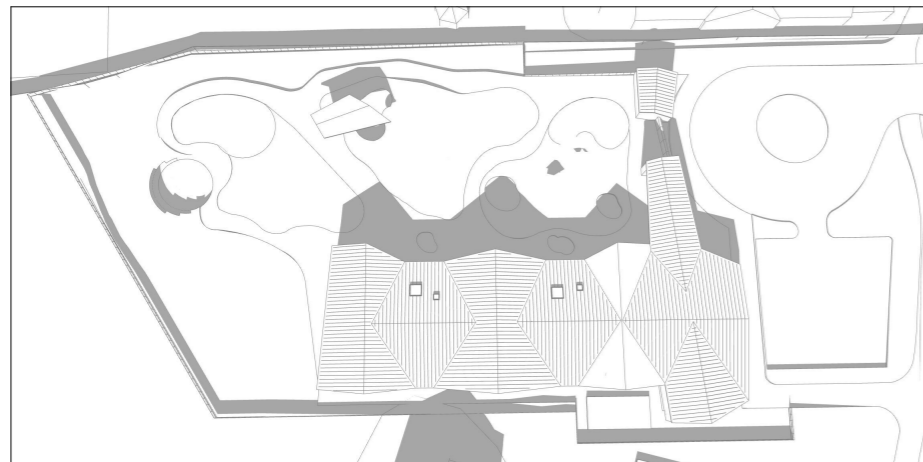
22. mars kl 12