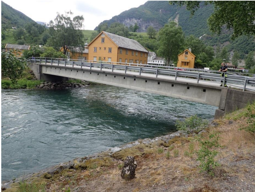
Figur 3-8. Bro i Flåm sentrum (profil 4458)