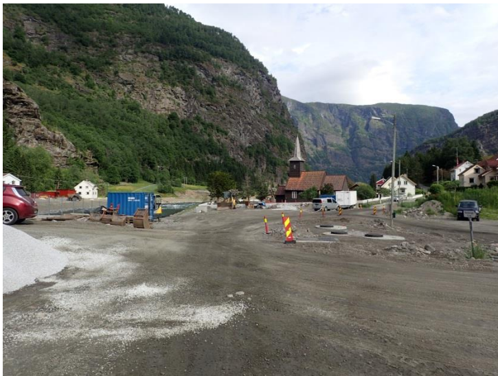
Figur 3-4. Området ved kirken (mellom profil 653 og 795)