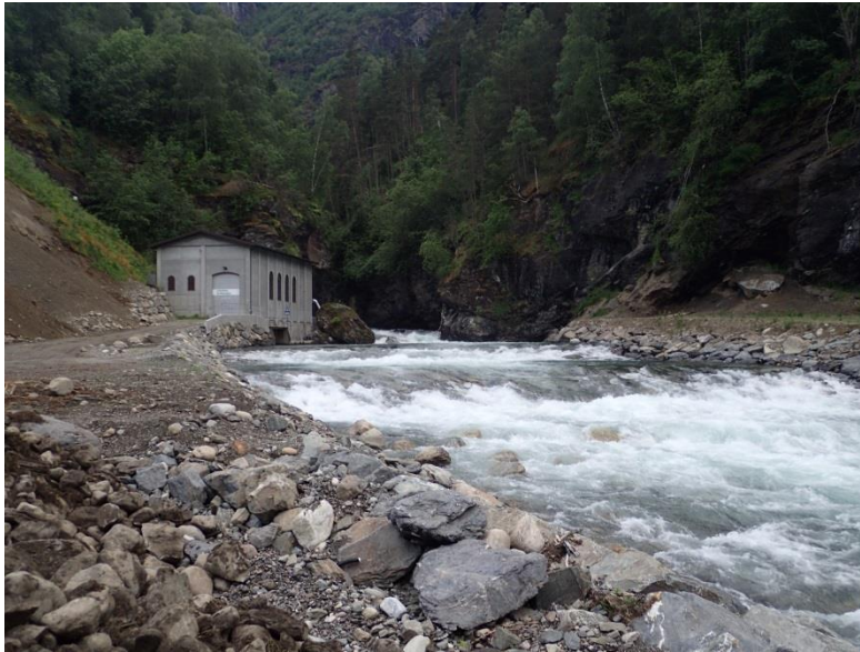
Figur 3-1: Leinafossen kraftverk