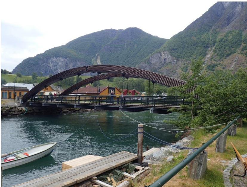
Figur 3-9. Bro ved utløpet til fjorden (profil 4714)