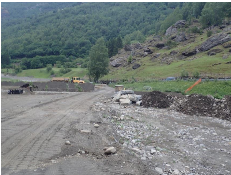
Figur 3-2: Rett nedstrøms kraftverket

I figur 3-3 er vist bilde av bro ved det nye vannmerket. Vannmerket sees i høyre i bildet. Brodekket ligger på 27,5 m o.h. og er 33,3 m langt. Lysåpningen er 30,8 m fratrukket midtpilar på 0,9 m. Fra topp brodekke er det ca. 3,5 m til bunn av elv.