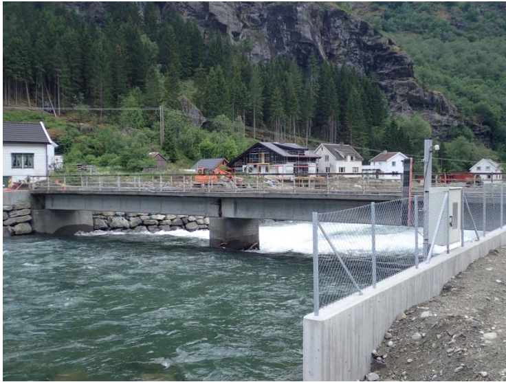
Figur 3-3. Bro ved Vm 72.77 Flåm (profil 653)