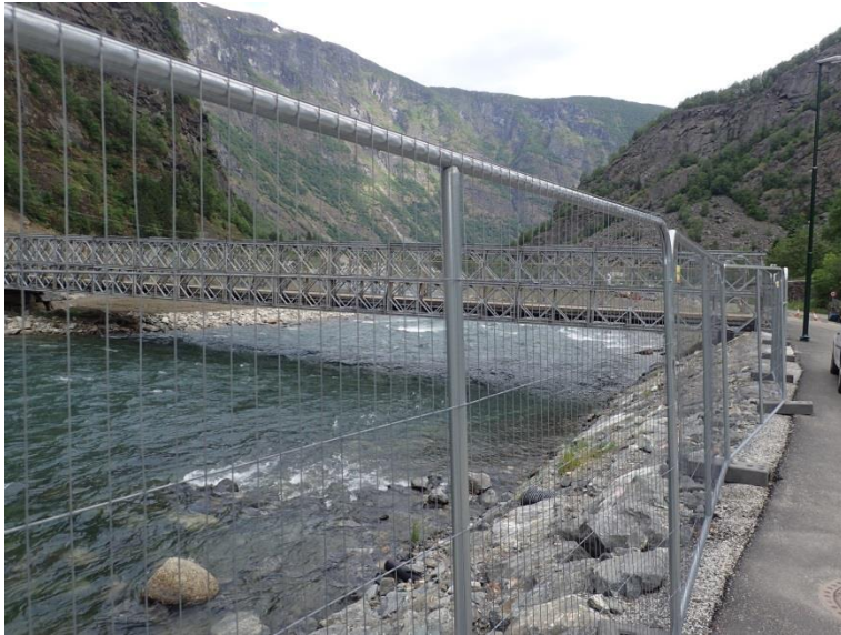
Figur 3-4. Midlertidig bro rett nedenfor skolen (profil 1425)