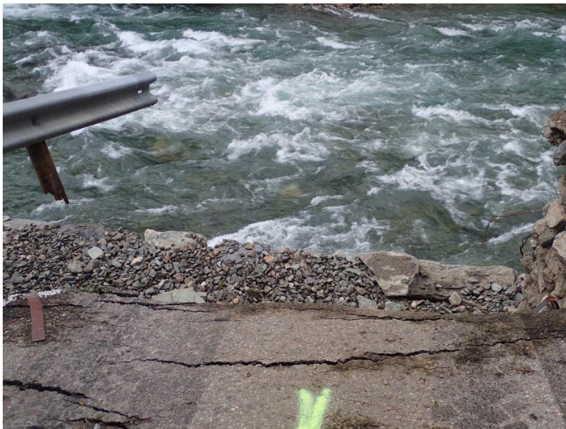
Figur 3-5. Rester av Brekke bro (profil 2505)

Figur 3-6 viser området Orøyane hvor det er planlagt nye hybelbygg som erstatning for eksisterende brakker.