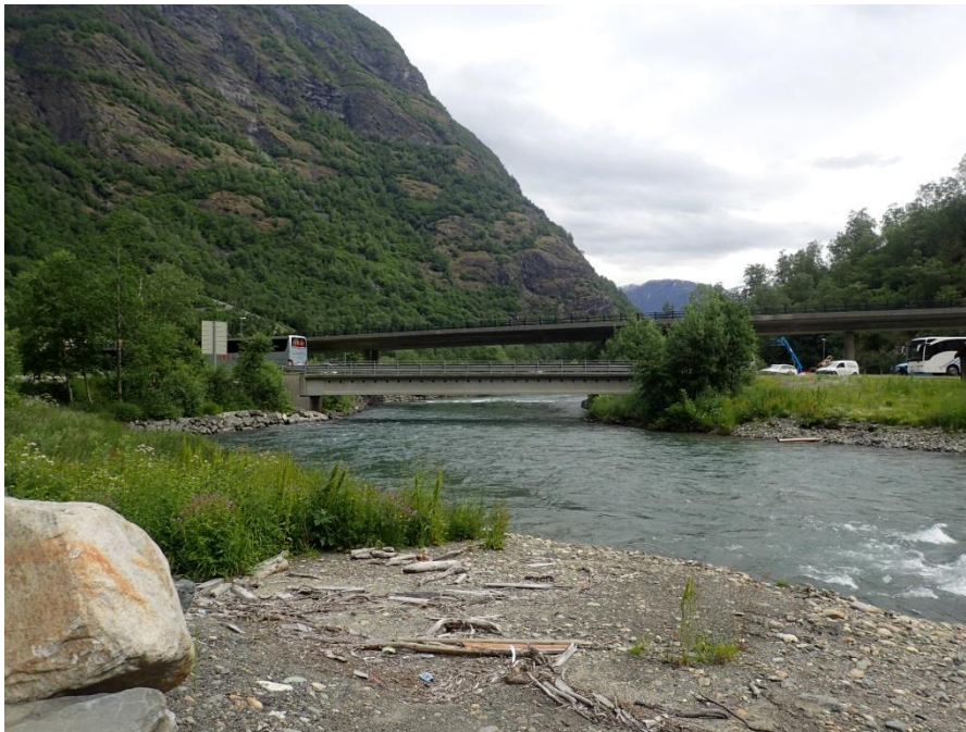
Figur 3-7. Bro for E 16 samt lokal bro (profil 3878)