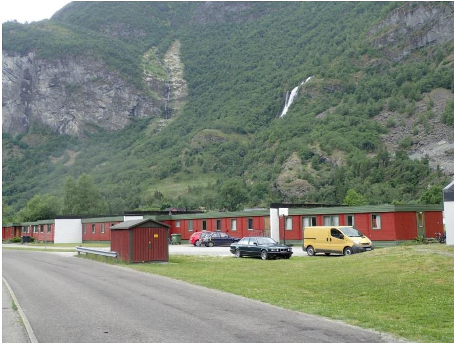
Figur 3-6. Ved Orøyane (profil 3612)